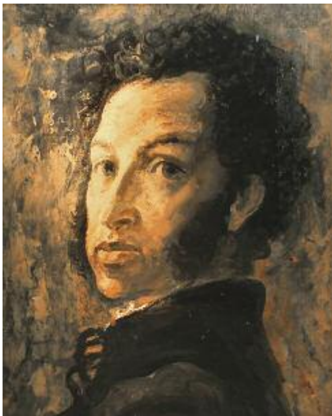
Б.А. ТАЛЬБЕРГ А.С. Пушкин 1980 Картон, масло 53 × 47,5

Большую часть иконографии Пушкина, хранящейся в музее, составляют работы художников второй половины XIX—начала XXI века. Эти ретроспективные изображения были созданы на основе изучения прижизненных натуральных портретов Пушкина, его автопортретов, творчества и биографии. Все они несут на себе печать своего времени, так как каждая эпоха находила в гении Пушкина то новое и животрепещущее, что было ей созвучно. «Первой удачной и любопытной попыткой создать воображаемый портрет Пушкина» по праву считается офорт Л.Е. Дмитриева-Кавказского, гравированный им в 1880 году под влиянием речи Ф.М. Достоевского на открытии памятника Пушкину в Москве. Также на выставке можно видеть работы В.Н. Масютина, М.В. Добужинского, В.А. Фаворского, К.С. Петрова-Водкина, В.И. Шухаева, Н.В. Кузьмина, Т.А. Мавриной, А.З. Иткина и других художников. Наибольшее количество портретов Пушкина было выполнено в юбилейные годы: 1937, 1949, 1987 и 1999.