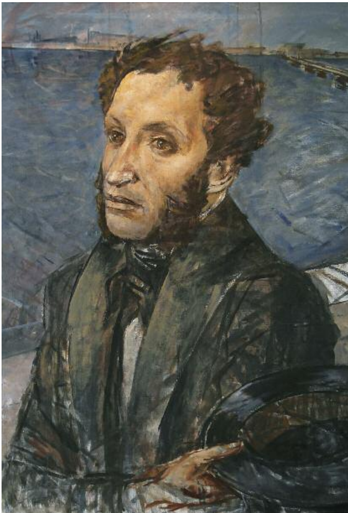
К.С. ПЕТРОВ-ВОДКИН Портрет А.С. Пушкина. 1934 Холст, масло. 70 × 51