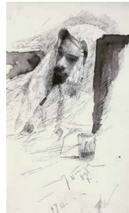
М.В.НЕСТЕРОВ Левитан в одежде бедуина. 1887 Картон, тушь, перо 19 × 11,7 Музей-заповедник В.Д.Поленова