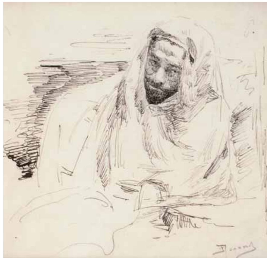
В.Д.ПОЛЕНОВ Левитан в одежде бедуина. 1887 Бумага, тушь, перо 14,8 × 14,8 Музей-заповедник В.Д.Поленова

Vasily POLENOV Levitan in Bedouin Clothes. 1887 Ink and quill on paper 14.8 × 14.8 cm Vasily Polenov Museum-Reserve