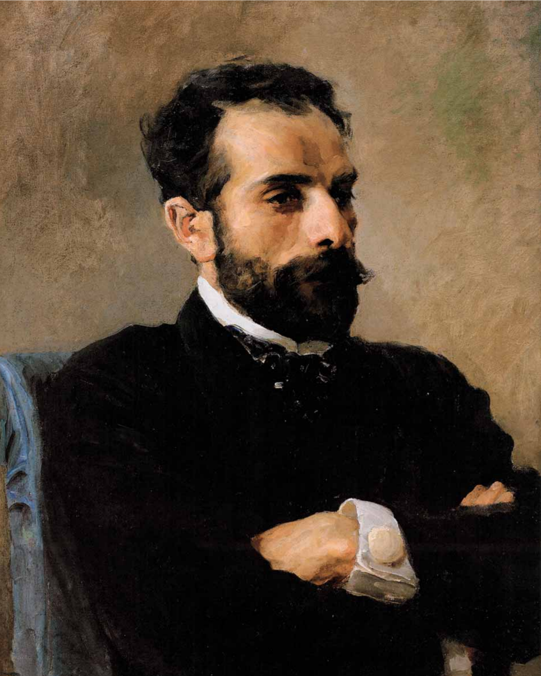
◀ В.Д.ПОЛЕНОВ Портрет И.И.Левитана. 1891 Холст на картоне, масло. 67 × 54 Частное собрание