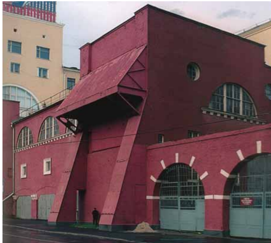
МОГЭС. Раушская наб. Москва. Арх. Иван Жолтовский. 1926