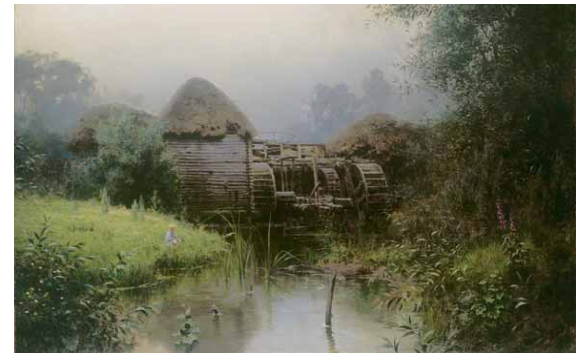
Vasily POLENOV An Old Windmill . 1890 Oil on canvas 88 by 135 cm