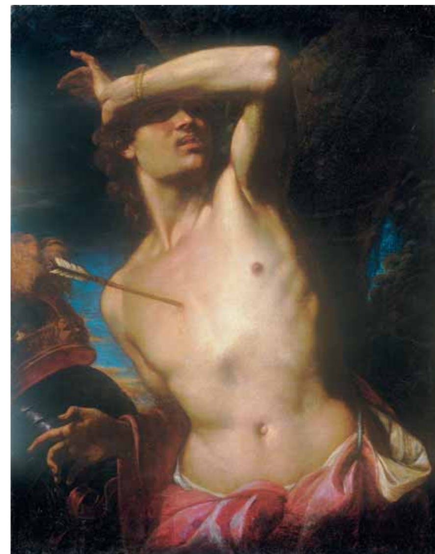
Джачинто БРАНДИ Св. Себастьян 1680-1690-е Холст, масло 94.5 × 74.5