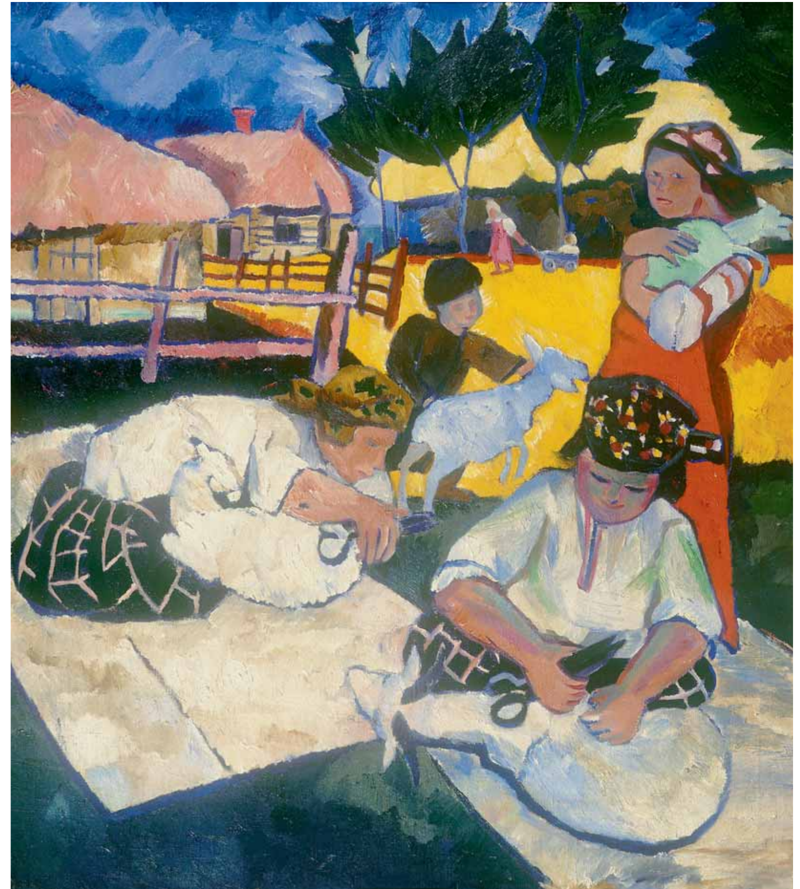
Н.С. ГОНЧАРОВА Стрижка овец. 1907 Холст, масло 118 × 102