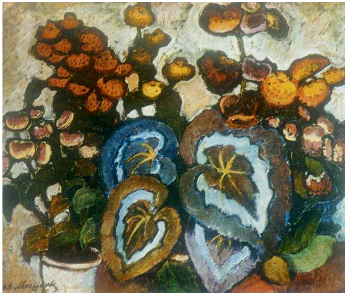
Илья MASHKOV Begonias. 1911 Oil on canvas 97 by 116 cm