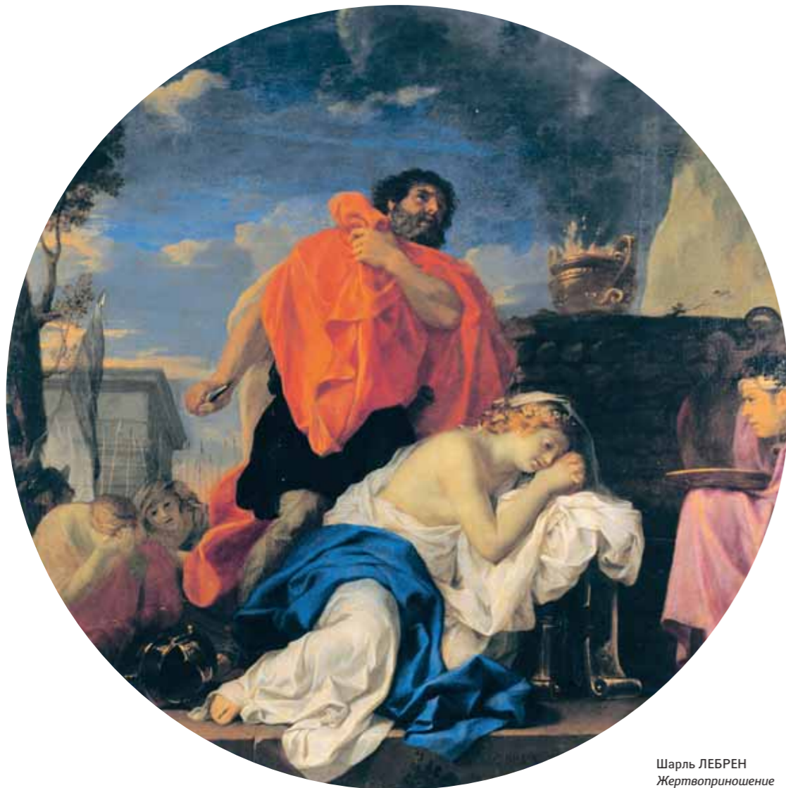
Шарль ЛЕБРЕН Жертвоприношение Иеффая Ок. 1656 Холст, масло Д. 131