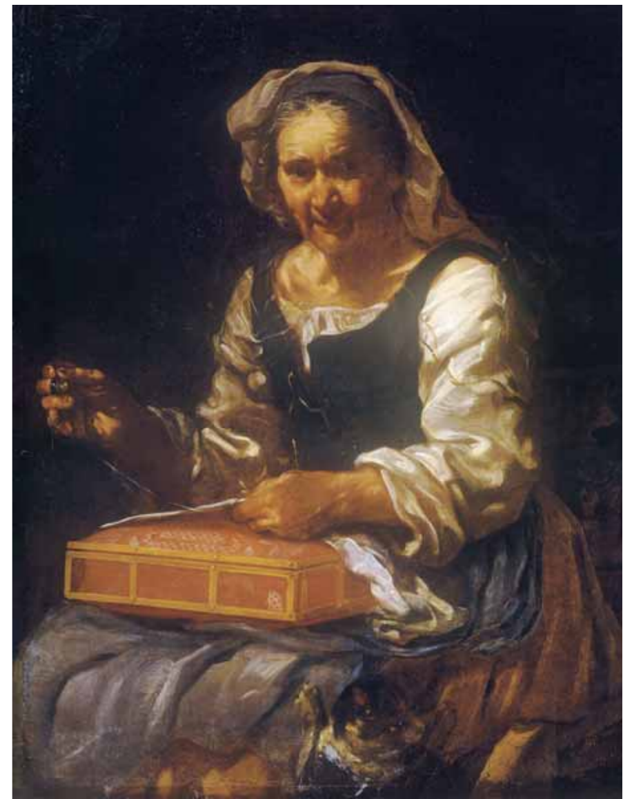
Eberhard KEIL (called Monsu Bernardo) An Old Woman with Needlework. 1650s Oil on canvas 98 by 76 cm

Orlov-Davydovs, nationalised in 1927–1931, which provided oil paintings, furniture and glass; and Rai-Semenovskoye, the estate of the Counts Nashchokins, previously Khutarevs, nationalised in 1927–1928, from which came furniture, paintings and books. Each of these groups of art objects in fact represents a random piece of an estate interior, formed starting from the late 18th century, rather than a specially established collection. The richest of them is the Semenovskoye-Otrada group, which provided such outstanding pieces of art as the painting by I. de Yauderville, a pupil of Rembrandt, "Scientist in his Study" (Inv. No. 38), and a carved table decorated with figures of atlantes designed by the architect G. Bosse and made by St. Petersburg's Isakov furniture workshop.