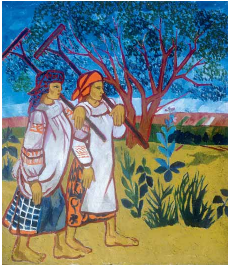
Н.С. ГОНЧАРОВА Бобы с граблями. 1907 Холст, масло 117 × 102