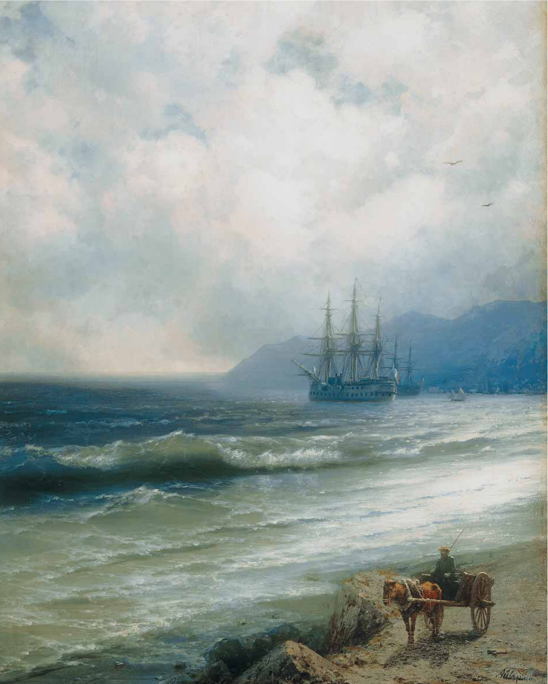
◀ И.К. АЙВАЗОВСКИЙ Прилив. 1870-е Холст, масло. 106 × 81