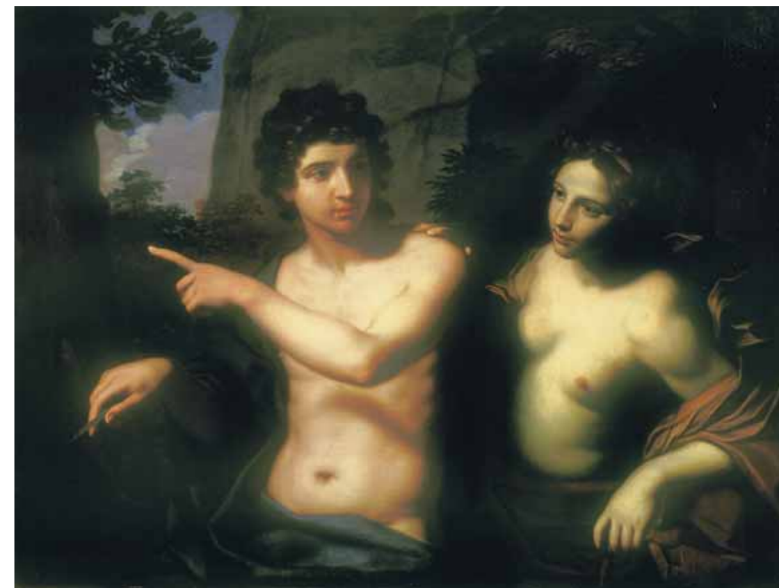
Микеле ДЕЗУБЛЕО (прозв. Флямминго) Медор и Анджелика 1640-е Холст, масло. 96 × 127

Покупая главным образом «на книжку», т.е. в кредит, и, видимо, чрез-