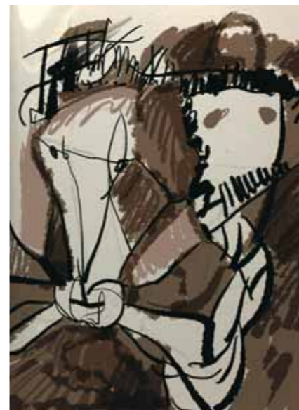
Евгений ЮСОВ Дон Кихот и Санча. 2005 Цифровая печать 70 x 50 Россия

The established structure of the Biennale as a whole consists of three sections: the open competition, the curators' projects, and the non-competitive programme, each complementing one another. Artists who don't fit into the conceptual framework of curators' projects can participate in the "Free Competition". The non-competitive programme allows for the display of graphic works outside the context of competition and addresses the history of previous Biennales. This time it is compact, consisting of three small exhibitions displaying the work of laureates of the 3rd Biennale -