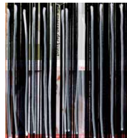
Ивица КАПАН Ярмарки искусства 2004 Бумага, см. техника 18 x 19 Австрия

The space of artistic experience comes to be expanded, and an enigmatic feeling of invention, of something new is born. This sets such a live exhibition apart from other more pompous, still-born events.