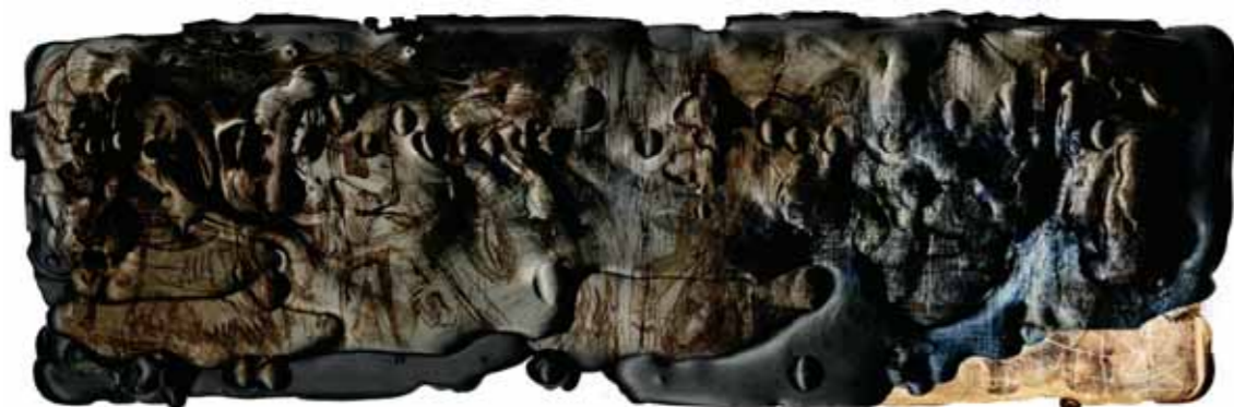
Ева ЛУДМАН Kora 2. 2004 Цифровая печать 35 x 100 Венгрия

The Novosibirsk Biennale of Graphic Art is characterized by an expanded