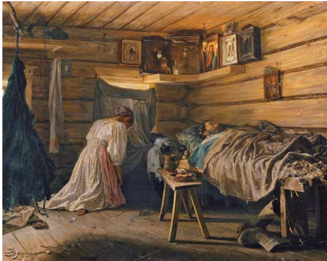
V.M. МАКСИМОВ Большой муж . 1881 Холст, масло 70,8×88,6 ГТГ