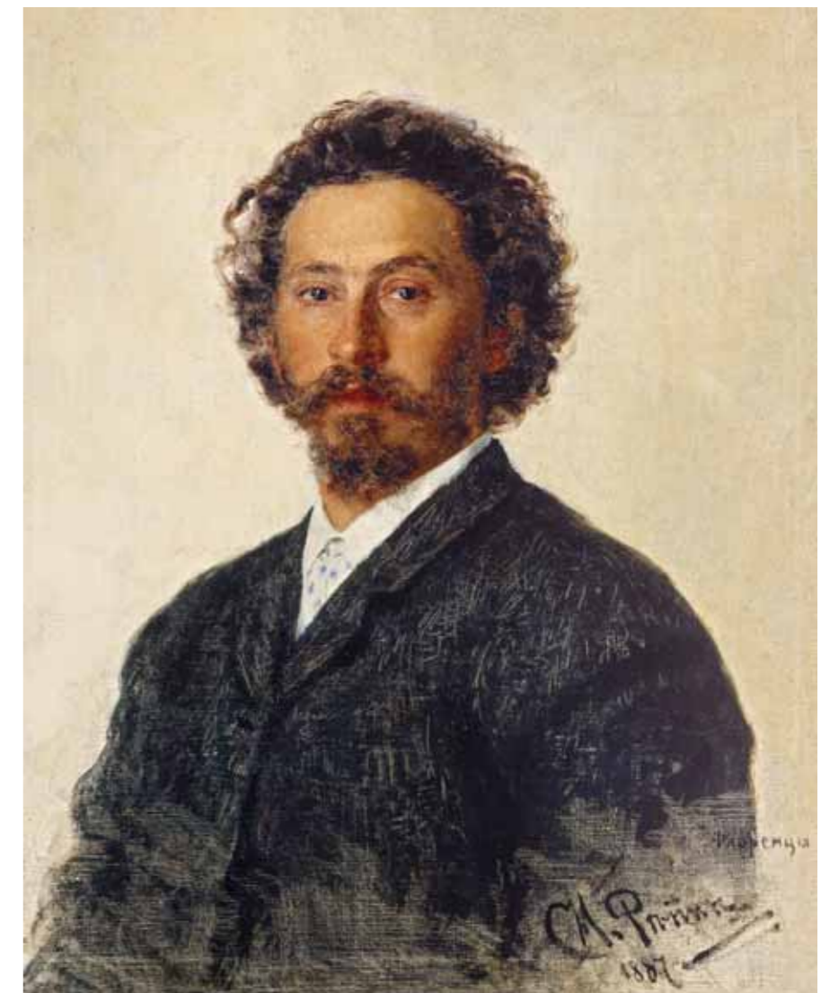
И.Е.РЕПИН Л.Н. Толстой на отдыхе в лесу 1891 Холст, масло. 60×50 ГГГ