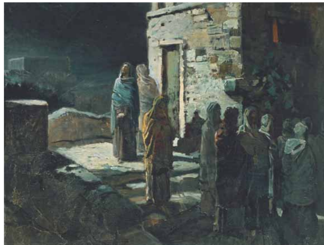
Н.Н.ГЕ ▶ Выход Христа с учениками в Тайной вечери в Гефсиманский сад . 1888 Холст, масло 65,3×85,5 ГТГ