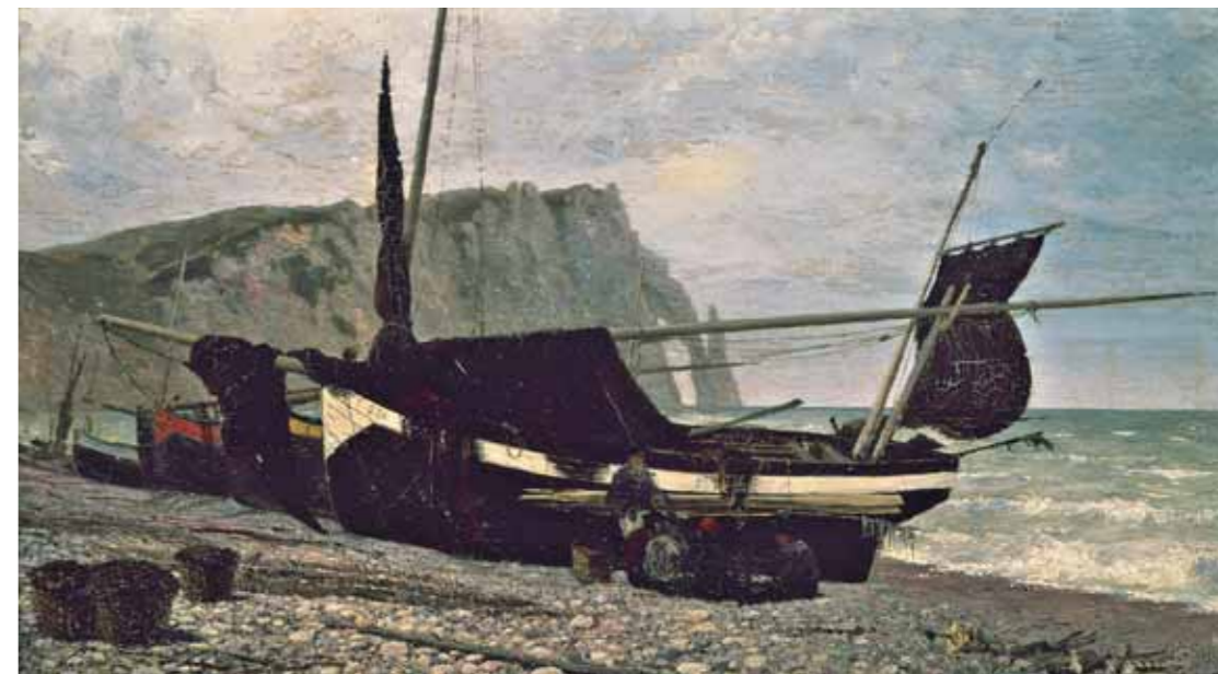
В.Д.ПОЛЕНОВ Рыбачья лодка . Этюд . 1874 Холст, лак. 39×64,5 ГТГ

Естественным завершением выставки становятся работы художника следующего поколения, самого талантливого ученика Репина – В.А.Серова. «Искусство Серова подобно драгоценному камню, чем больше вглядываешься в него, тем глубже он затягивает вас