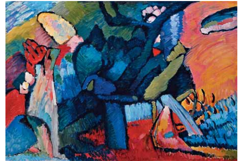
К.С.МАЛЕВИЧ Косарь. 1912 Холст, масло 113,5 x 66,5