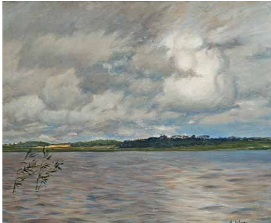
И.И.ЛЕВИТАН Озеро. Серый день 1895 (?) Этюд Картон, масло 47,5 × 57,3