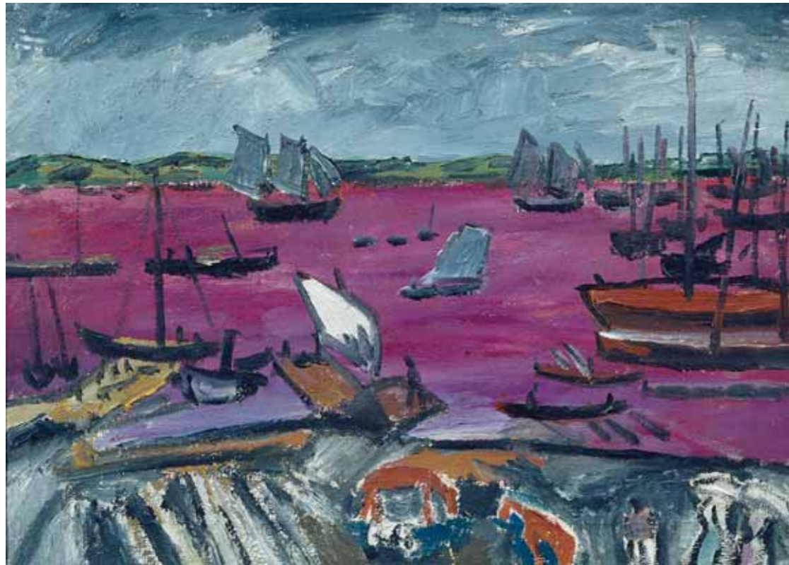
М.Ф.ЛАРИОНОВ Море. 1912-1913 Холст, масло 50 x 70,5