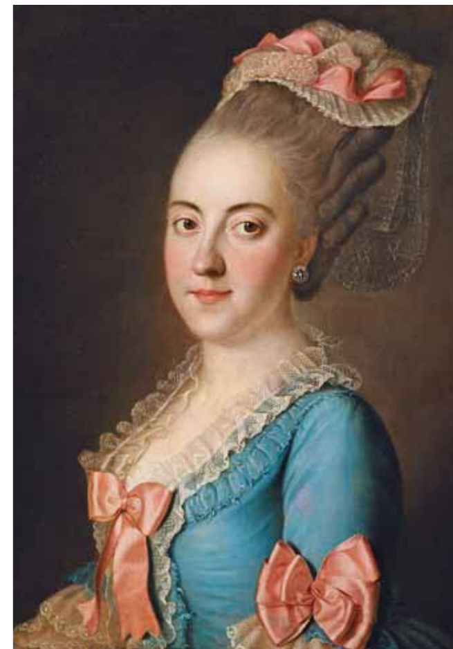
И.С.САБЛУКОВ Портрет неизвестной . 1770-е Холст, масло 63,3 x 50,2

Уже при открытии первой экспозиции стало очевидно, что новое худо-