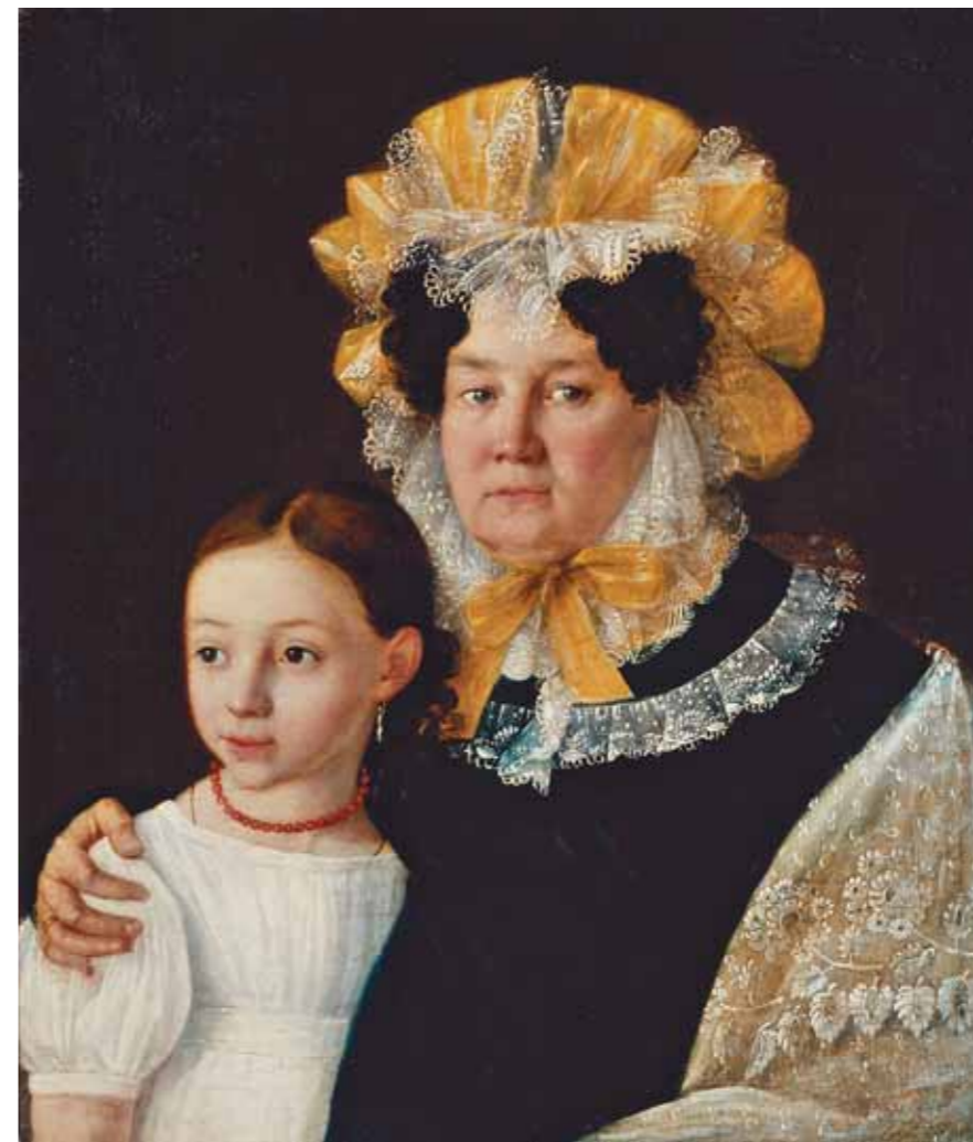
Ivan GORBUNOV Grandmother and Granddaughter . 1831 Oil on canvas 66.5 by 57.7 cm