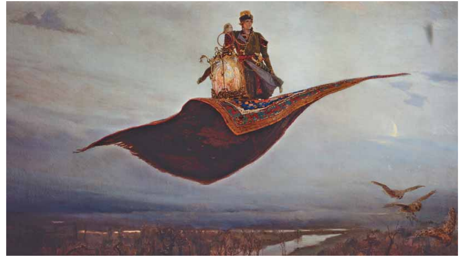
В.М.ВАСНЕЦОВ Ковер-самолет. 1880 Холст, масло 165 × 297

Even the very first exhibition showed an exceptionally high artistic level of paintings and a prevalence of classical trends in the newly opened museum, which distinguished it from other provincial art collections. There was nothing surprising about that, since Karelin personally addressed painters from academic circles and those who specialised in historical painting with requests to donate their works to the museum.