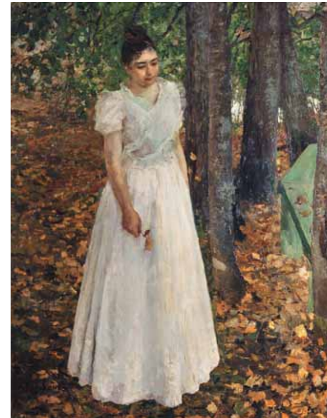
Konstantin KOROVIN Autumn. 1891 Oil on canvas 175 by 132 cm

ников, сложилась довольно драматично. С 1920-х годов это полотно хранилось на валу и более 70 лет не выставлялось. Оно значительно пострадало во время Великой Отечественной войны, поскольку из-за внушительных размеров (четыре на пять с половиной метров) не было эвакуировано с основной коллекцией в Новосибирск. Только в 1996 году, к 100-летию музея, после проведения необходимых реставрационных работ первый музейный предмет вернулся в экспозицию уже в специальный мемориальный зал нового здания бывшего Дворца губернатора. Не так давно оказались востребованы и подаренные автором эскизы. По ним восстанавливались кошелевские плафоны и барабан центрального купола возрожденного храма Христа Спасителя.