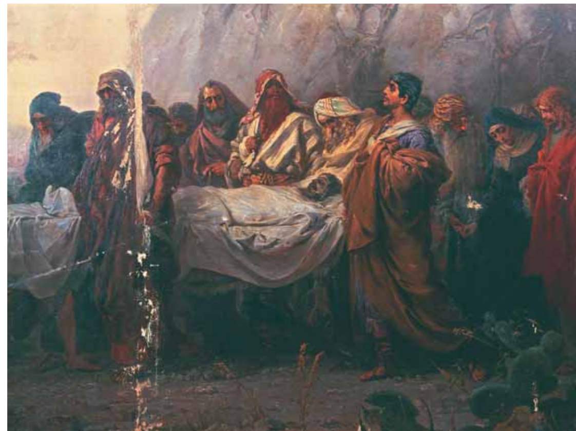
Н.А.КОШЕЛЕВ Погребение Христа 1881 Холст, масло 400 × 540

It is worth mentioning that the two departments functioned rather independently of each other, staging their own exhibitions and publishing their own catalogues, and soon even moved to different buildings. In 1934 they were officially separated.