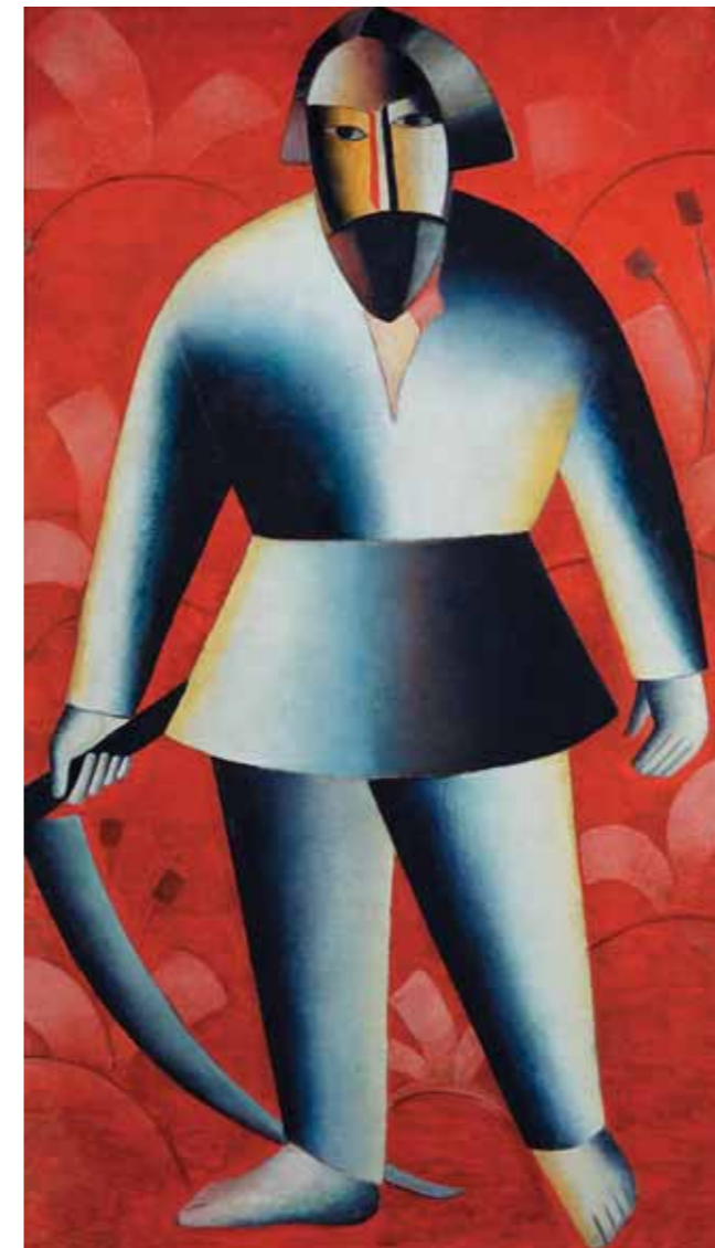
Kazimir MALEVICH Hay-maker. 1912 Oil on canvas 113.5 by 66.5 cm

великого князя Николая Михайловича, барона Н.Н.Врангеля, комиссара Таврической выставки С.П.Дягилева. На эту грандиозную выставку из музея были тогда отправлены две работы и благополучно возвращены назад. Конечно, из нынешнего собрания на Таврической выставке их было гораздо больше – не менее пятнадцати, достаточно назвать хотя бы такой шедевр русской графики, как «К.А.Обнинская с зайчиком» В.А.Серова.