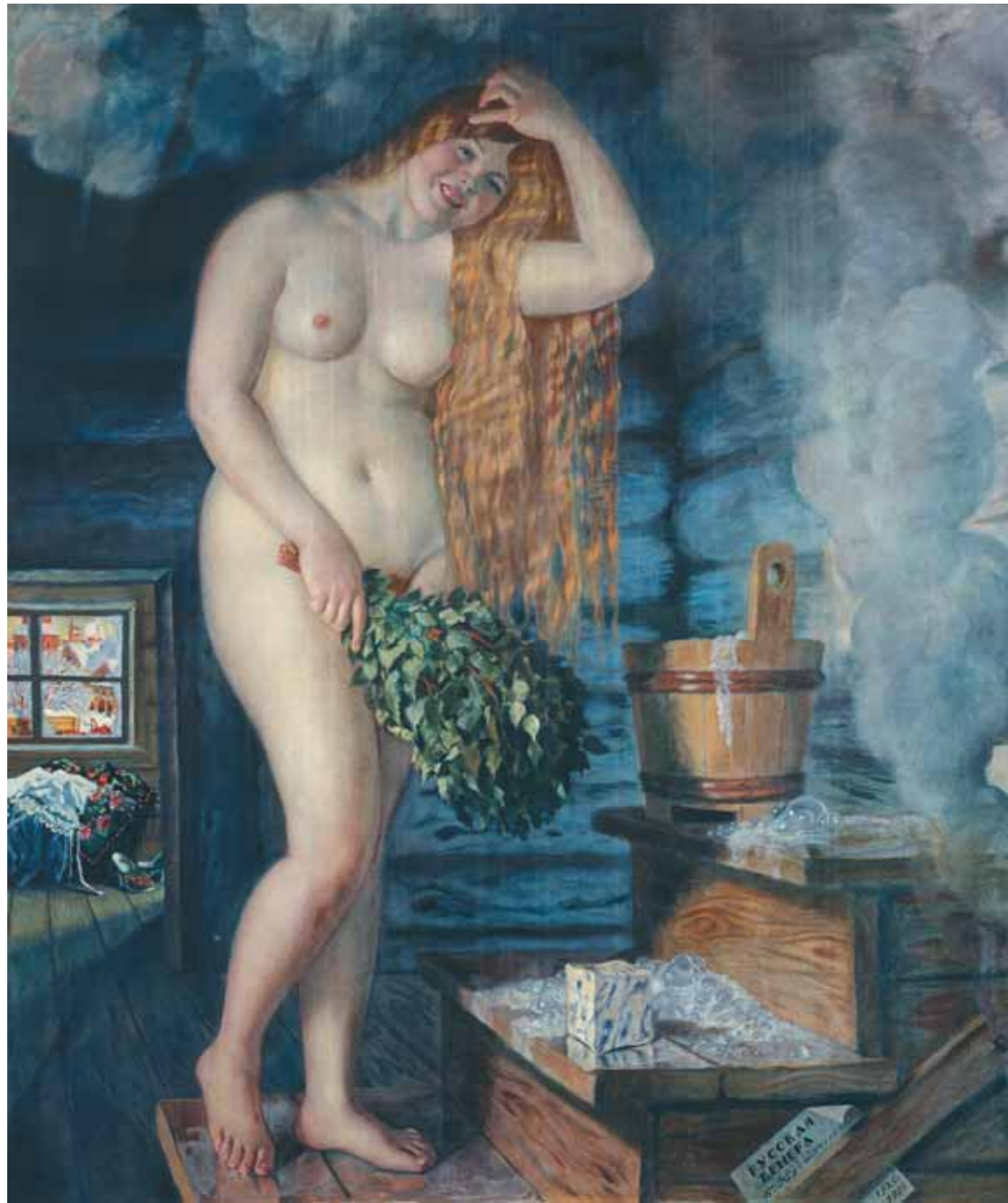
Б.М.КУСТОДИЕВ Русская Венера 1925–1926 Холст, масло 200 × 175