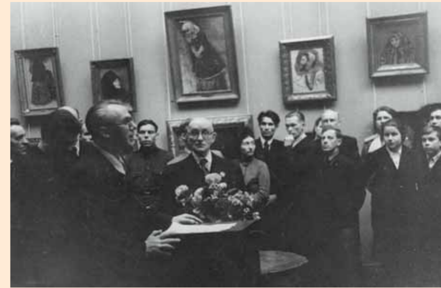
The Tretyakov Gallery Opening Ceremony in the Vasily Surikov room on 17 May 1945

делам искусств был издан приказ № 545 «О эвакуации и мерах по обеспечению сохранности при ее проведении художественных коллекций музеев г. Москвы и Московской области». 30 октября тридцать сотрудников филиала ГТГ получили пропуск на въезд в Москву.