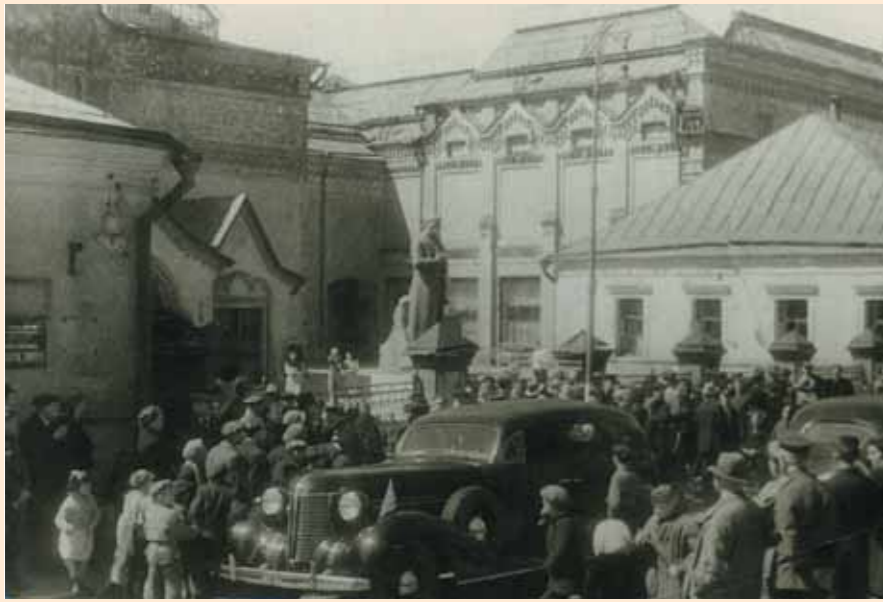
В день открытия Галереи после эвакуации. 17 мая 1945