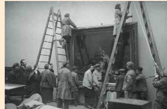
Повеска картины И.Е.Репина «Иван Грозный и сын его Иван 16 ноября 1581 года». 1945