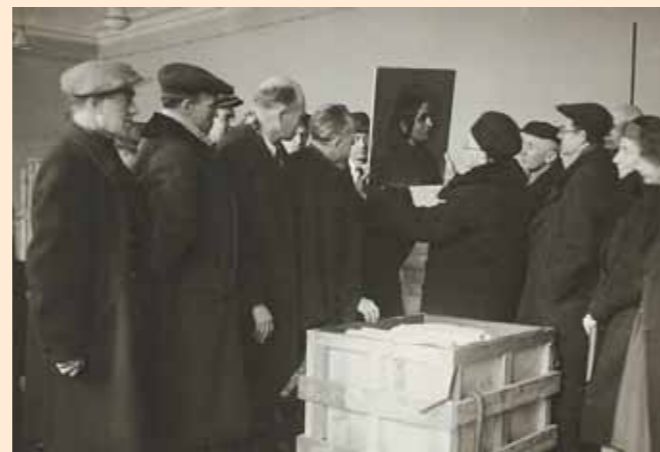
Unpacking the boxes with the paintings which arrived from evacuation. State Tretyakov Gallery. 1944