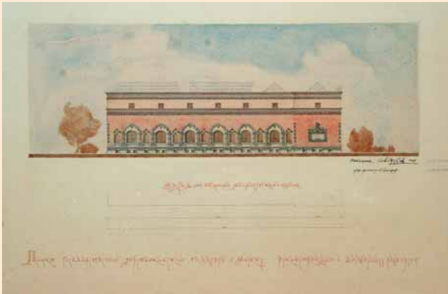
Первоначальный проект А.В.Щусева пристройки к Галерее. 1944