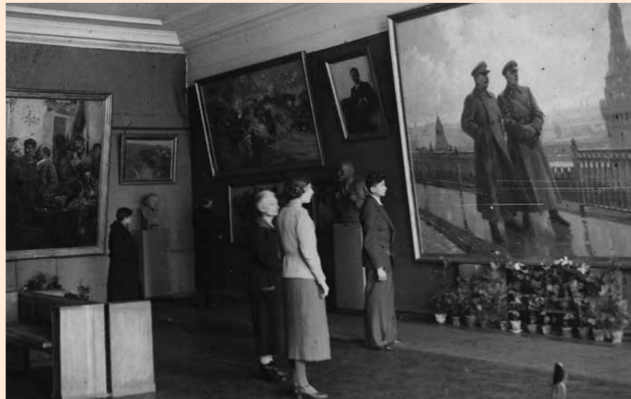
Выставка «Лучшие произведения советского искусства» Новосибирск. 1942