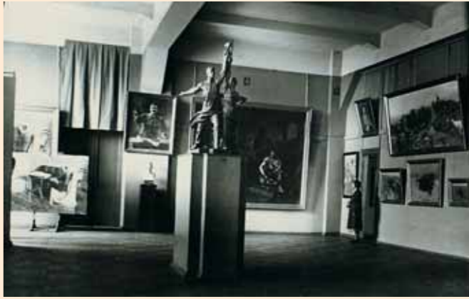
Выставка к Ленинским дням в ДOME Красной Армии, Новосибирск.1942

К концу 1941 – началу 1942 года в Оперном театре Новосибирска было сосредоточено огромное количество художественных и культурных ценностей мирового значения. Прибыли экспонаты ленинградских, горьковского, смоленского и сумского музеев. В фонды филиала были приняты произ-