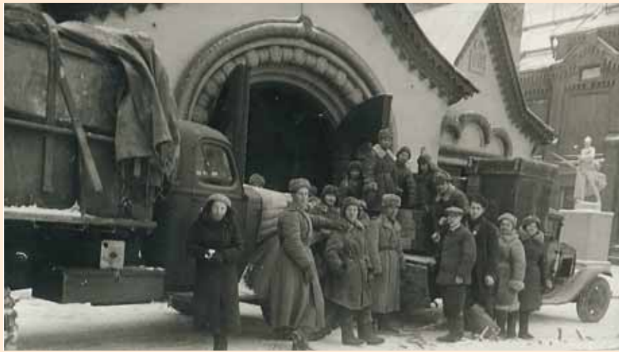
Возвращение художественных произведений в Москву. 1944