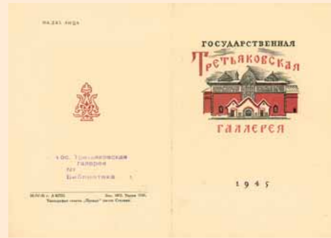
Пригласительный билет на открытие ГТГ. 1945