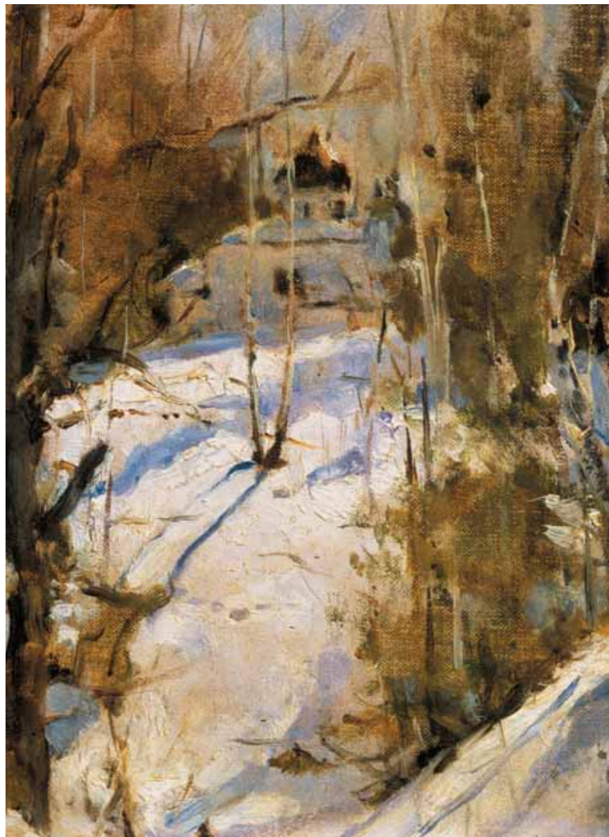
В.А.СЕРОВ Зима в Абрамцеве 1886. Этуд Холст, масло. 20×15,5 ГТГ