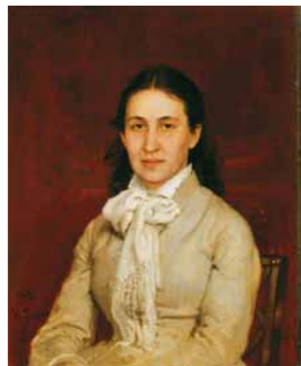
И.Е.РЕПИН Портрет С.И.Мамонтова. 1878 Холст, масло. 71×58 Музей-заповедник «Абрамцево»