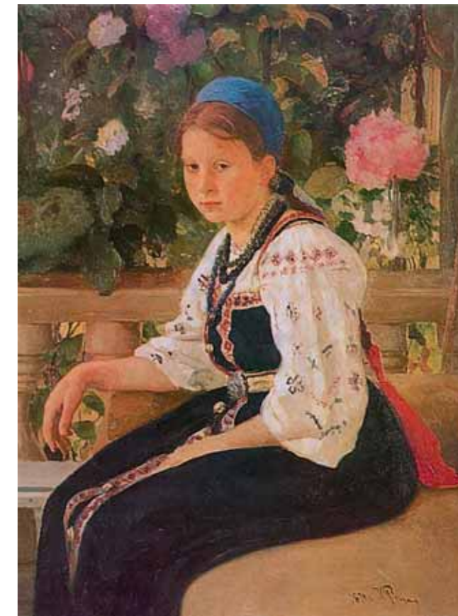
И.Е.РЕПИН Портрет С.Ф.Мамонтовой 1879 Холст, масло 89×69 Музей-заповедник «Абрамцево»

The local landscape was also reflected in numerous portraits created in Abramtsevo. Nature plays an important part in canvases such as Repin's "Portrait of S. Mamontova" (1879), Viktor Vasnetsov's "Portrait of Vera Mamontova" (1896), both in the Abramtsevo Museum, and Serov's "Girl with Peaches" (1887, State Tretyakov Gallery). Landscape is an integral part of this famous portrait of Verushka Mamontova, an important element of its imagery, and the artist's aim – to render the "freshness of a first impression" – is akin to the task of a "mood landscape" painter.