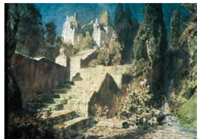
Vasily POLENOV Castle Staircase , 1883 Sketch for a scene from Mamontov's "Red Rose" Watercolour on paper 25.3 by 33.8 cm Abramtsevo Museum

другой. Свое завершение этот тип пейзажа получил в полотне «Осень в Абрамцеве» (1890), работе, отличающейся строгой декоративно-ритмической организацией, тщательной выверенностью всей композиции и отдельных ее деталей, богатством и разнообразием живописного строя.