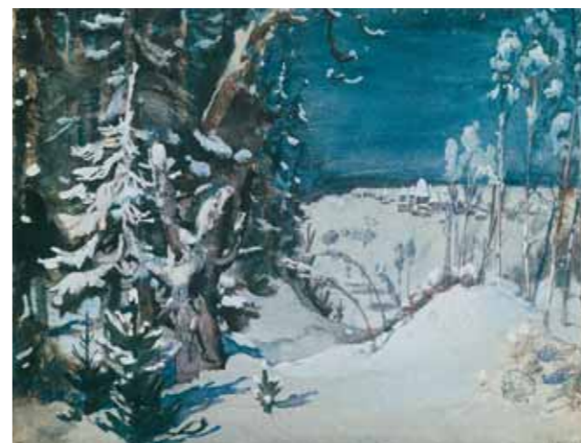
А.М. ВАСНЕЦОВ Абрамцево. 1884 Этюд Дерево, масло 31,5×24,7 Музей-заповедник «Абрамцево»

This evolution in Polenov's landscape is likewise evident in the artist's theatre work. In his "Atrium" for Apollon Maikov's "Two Worlds" (1879), Polenov uses his open-air experience to create an ancient courtyard bathed in airy light. Several years later, in the "Castle Staircase" set for Savva Mamontov's "Red Rose" (1883), he creates a moonlight