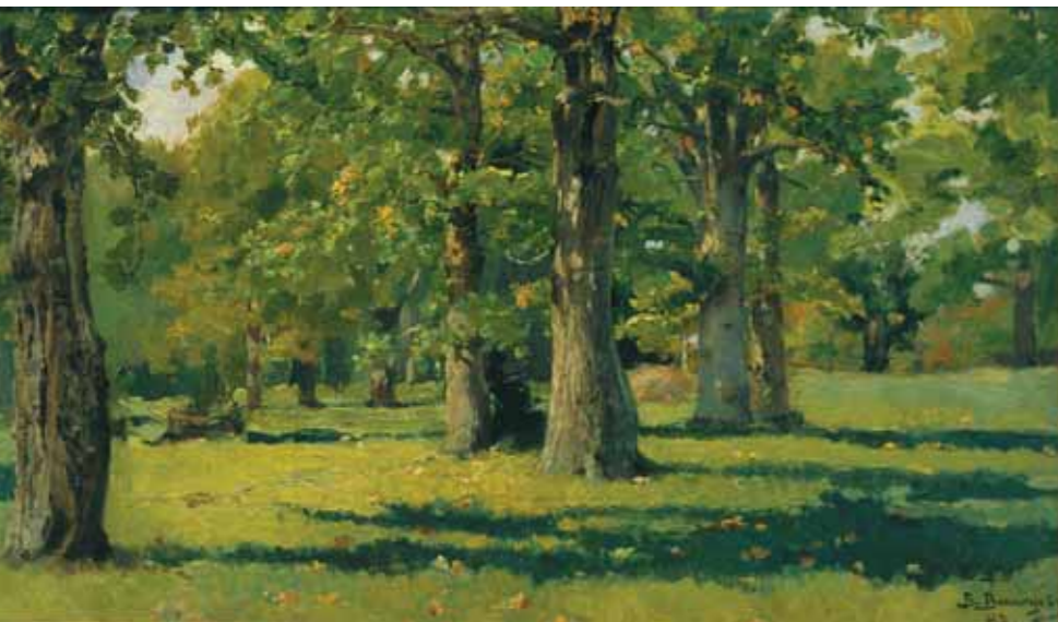
В.М.ВАСНЕЦОВ Дубовая роща в Абрамцеве. 1883 Холст на картоне, масло. 36×60 ГТГ