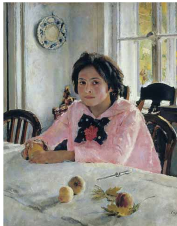
Valentin SEROV Girl with Peaches. 1887 Oil on canvas 91 by 85 cm

образный жанр – пейзаж-картина. Речь идет об уже названных работах Репина «На меже», «На мостике в парке», «Абрамцево», о картине Поленова «На лодке» (1880). Впервые в русском искусстве жизнь усадьбы как таковой, разнообразие ее мотивов, впечатление от них, меняющееся в разное время года и суток, подверглись столь пристальному вниманию художников. Состояние лирической созерцательности, ощущение радости от погожего летнего дня и элегического грусти, навеянной осенним увяданием природы, зимняя пора – все становится предметом художественного осмысления, предвосхищая поэтику усадебных мотивов В.Э.Борисова-Мусатова, С.Ю.Жуковского, художников «Мира искусства», одной из главных тем которых стала жизнь русской усадьбы, эстетизация старины.