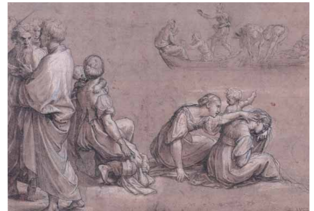
RAPHAEL Sketch for the cartoons for the Sistine Chapel tapestry "The Miraculous Draught of Fishes" Circa 1515 Pen, brown ink over a drawing in chalk 229 by 327 mm