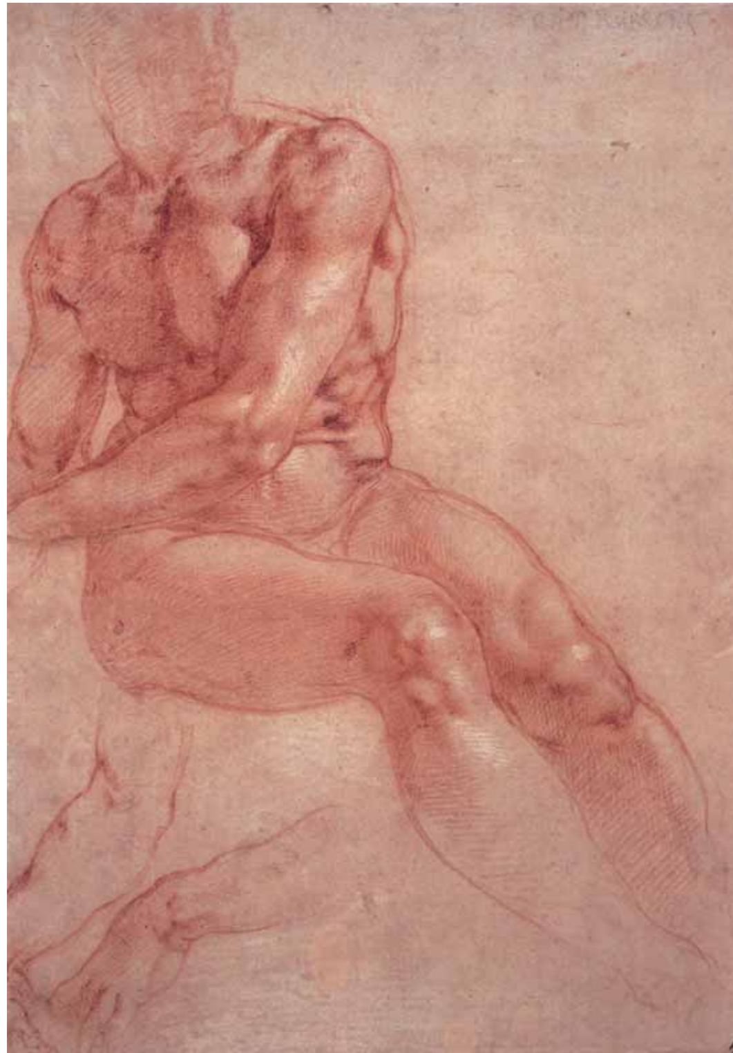
МИКЕЛАНДЖЕЛО БУОНАРРОТИ Сидящий обнаженный юноша и два этюда руки Около 1511 Сангина и уголь, перо, коричневая тушь, белая заливка. Следы наброска грифельным карандашом. 272×192 мм

Микеланджело оставил после себя грандиозные по своему масштабу произведения искусства. Сегодня, приходя на поклонение к ним, мы выглядим просто карликами. Гигантские, беспрерывно расширяющиеся росписи потолков и стен Сикстинской капеллы, монументальные мраморные статуи, поражающие наше воображение, являются примерами титанизма, величия вложенного труда. Но среди его необъятного наследия до нас дошли в том числе хрупкие, маленькие квадратички старинной бумаги, которые являются драгоценными свидетельствами самой сущности великих откровений мастера.