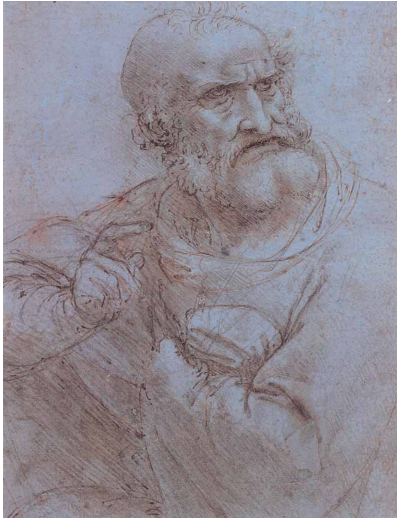
ЛЕОНАРДО ДА ВИНЧИ Апостол. 1493–1495. Перо, коричневая тушь на голубой бумаге. Следы серебряной палочки. 146×113 мм