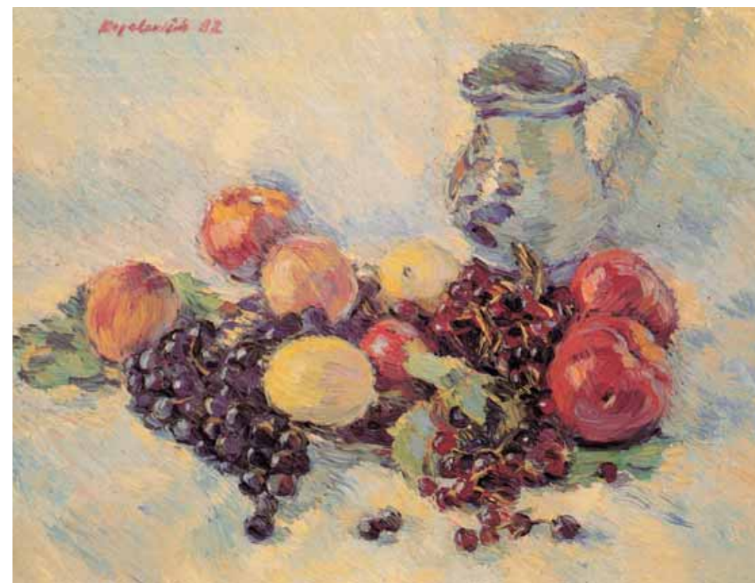
А.КОПЕЛОВИЧ Фрукты Холст, масло 66x51