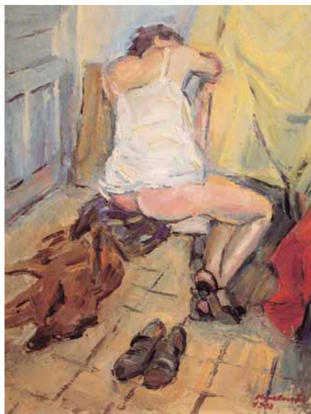
А.КОПЕЛОВИЧ В мастерской Холст, масло 68x54