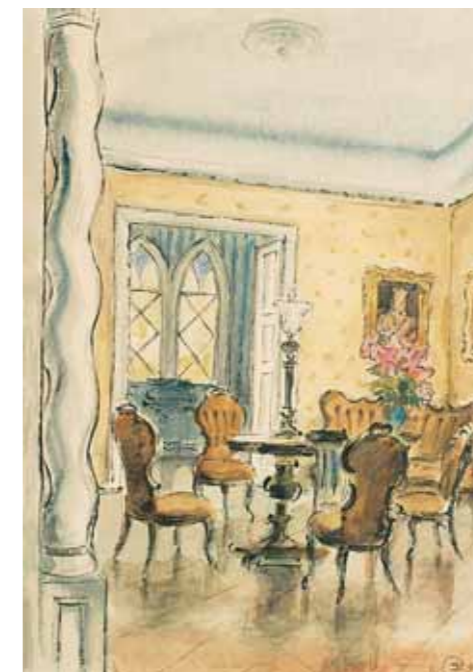
МИХАИЛ ДОБУЖИНСКИЙ. Интерьер. 1933. Бумага, акварель. Собрание РФК