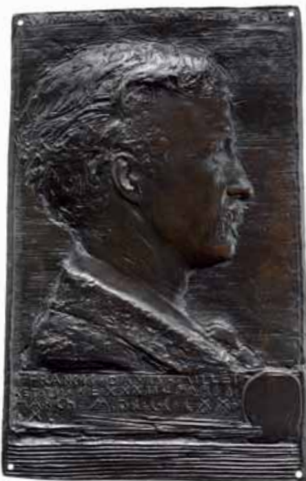
Френсис Дэвис Миллет. 1879 Бронза. 27 × 17,1 Дар г-жи Ф.У.Адлард, 1910