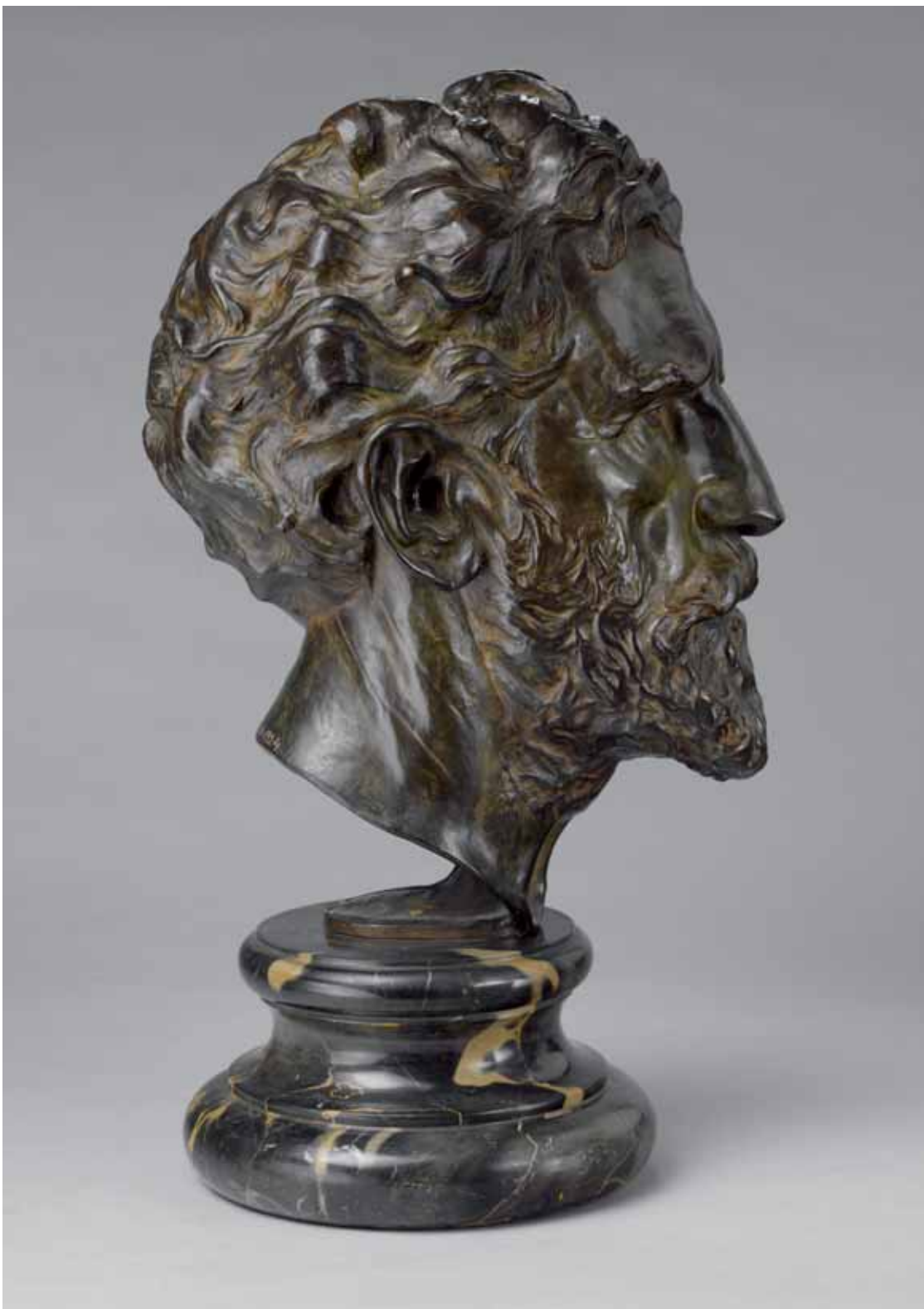
Джон ФЛАНАГАН Ogastec Сент-Годенс 1905–1924 Бронза 41,9 × 20,3 × 25,4 Отливка 1924 года Приобретено Фондом Франсиса Латропа, 1933