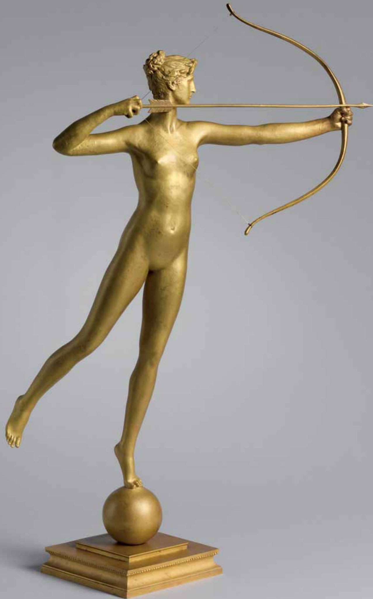
♦ Diana . 1893–1894 Бронза 71,8 × 41,3 × 35,6 Отливка 1894 года или позднее Дар Линкольна Кирстейна, 1985