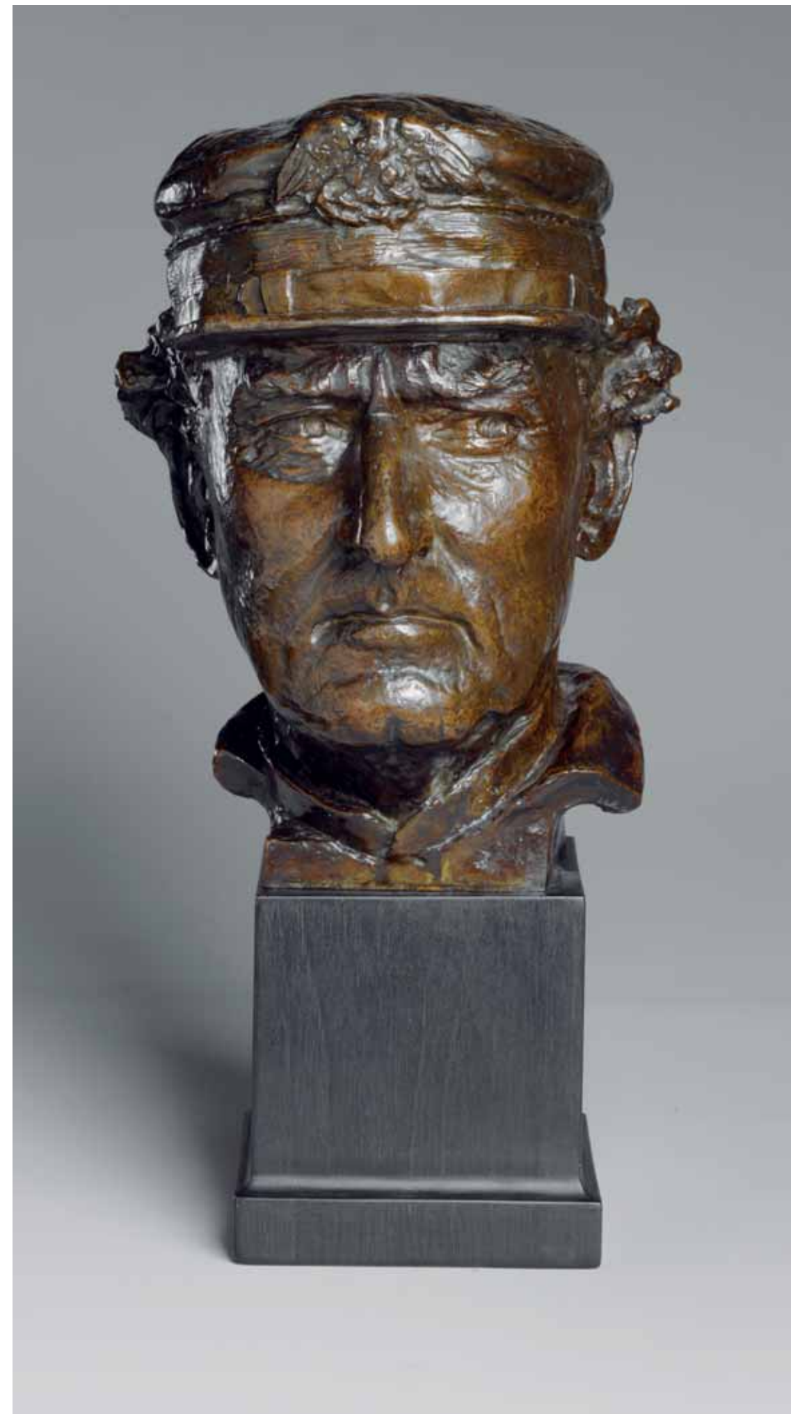
Admiral David Glasgow Farragut 1879–1880 this cast, 1910 Bronze and marble 27.9 × 20.3 × 22.2 cm Gift by subscription through the Saint-Gaudens Memorial Committee, 1912 (12.76.3a, b)