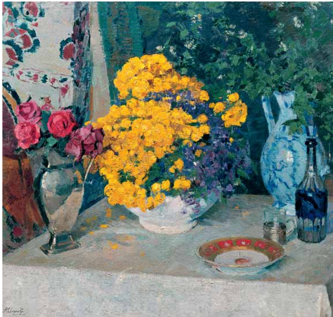
Натюрморт с купавками. 1918 Холст, масло 102,5 × 115

В октябре 1921 года Исуповы вернулись в Москву. На первых порах Алексея Владимировича угнетали неустойчивость с жильем и материальные трудности. В этот сложный, напряженный период ему в прямом смысле слова приходилось бороться за существование. Подобно многим коллегам, Исупов