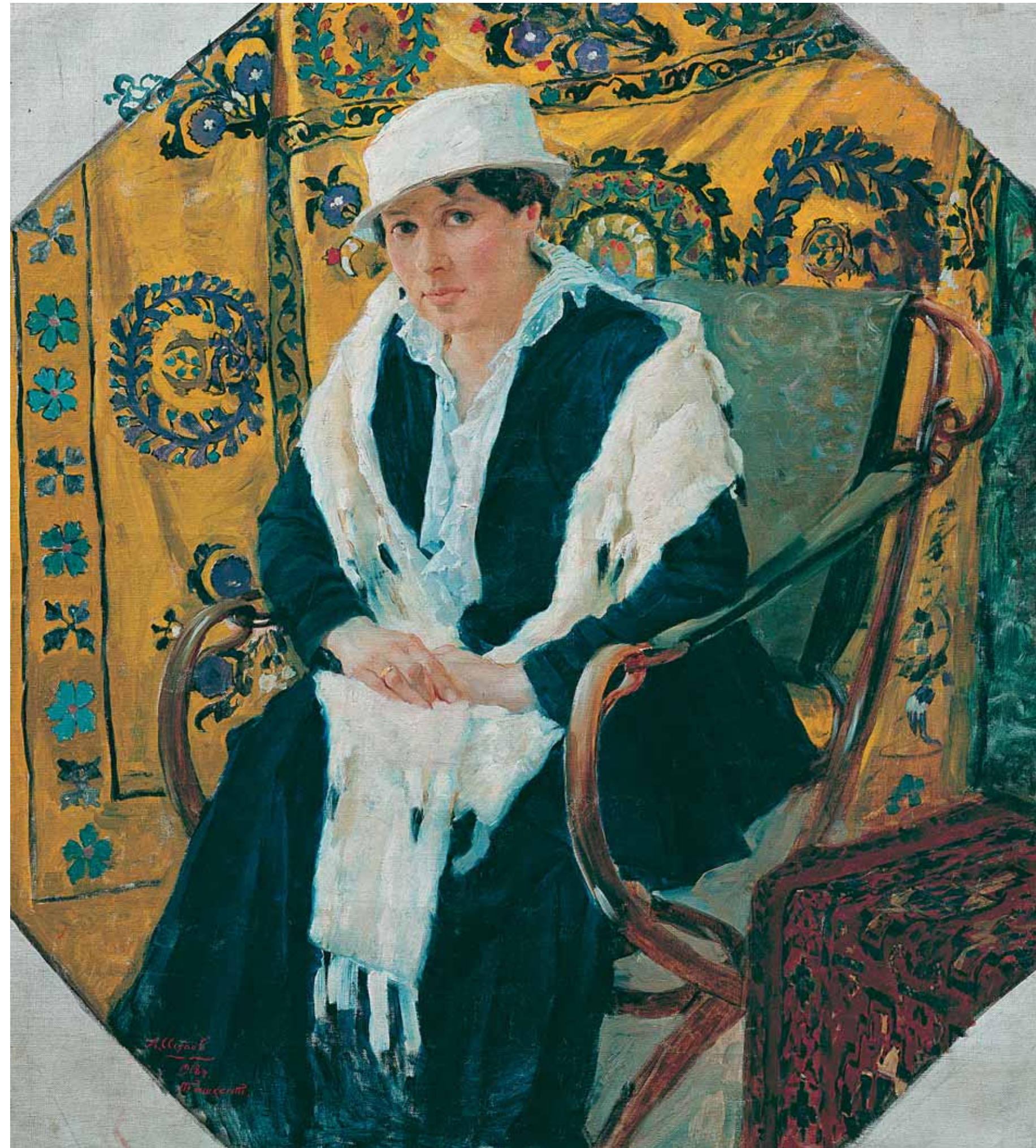
Портрет жены художника. 1918 Холст, масло 102 × 90,5

Isupov's art of that period was developing in accordance with the values of the Union of Russian Artists. The Union rep-