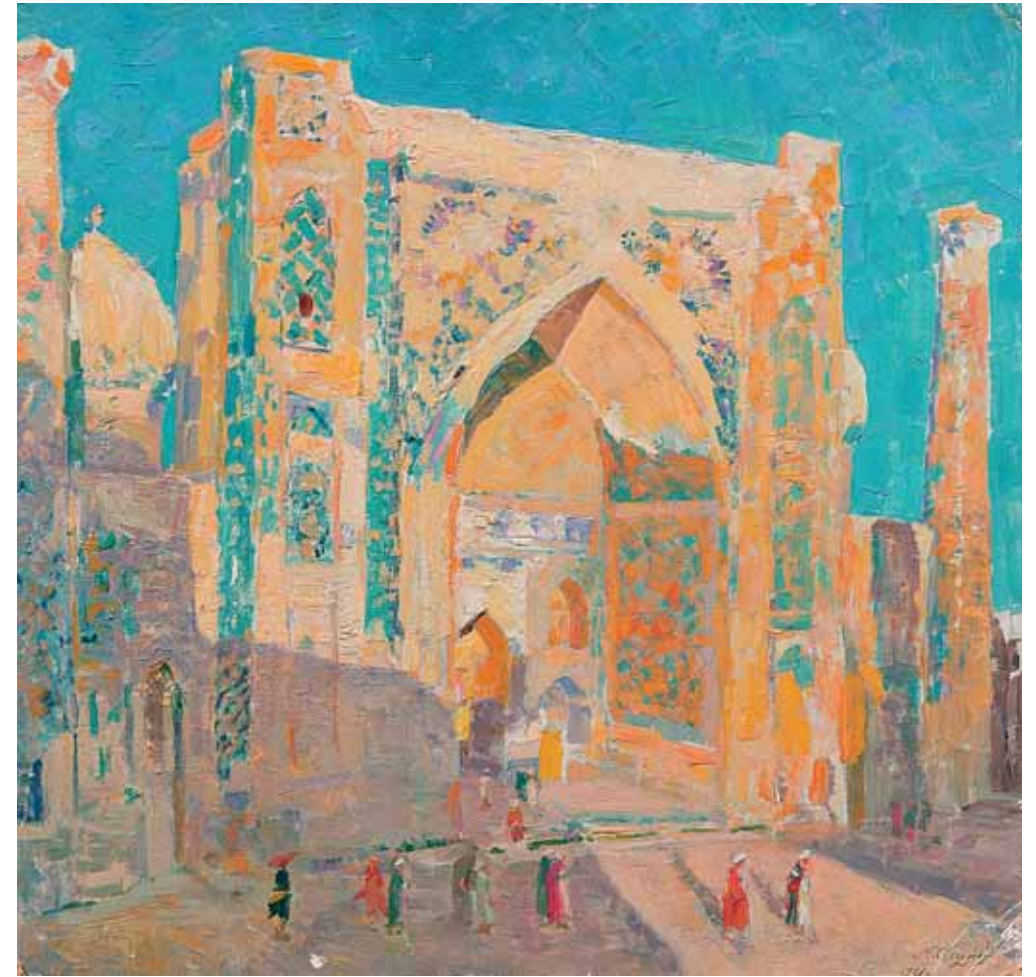
Самарканд. 1921 Картон, масло 37,5 × 50