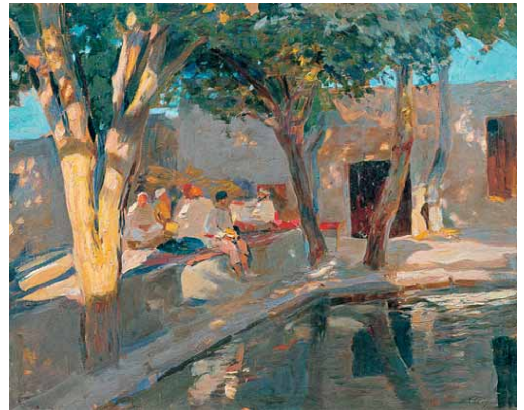
Tea-house. By the Pond 1920–1921 Oil on canvas. 45 × 55 cm