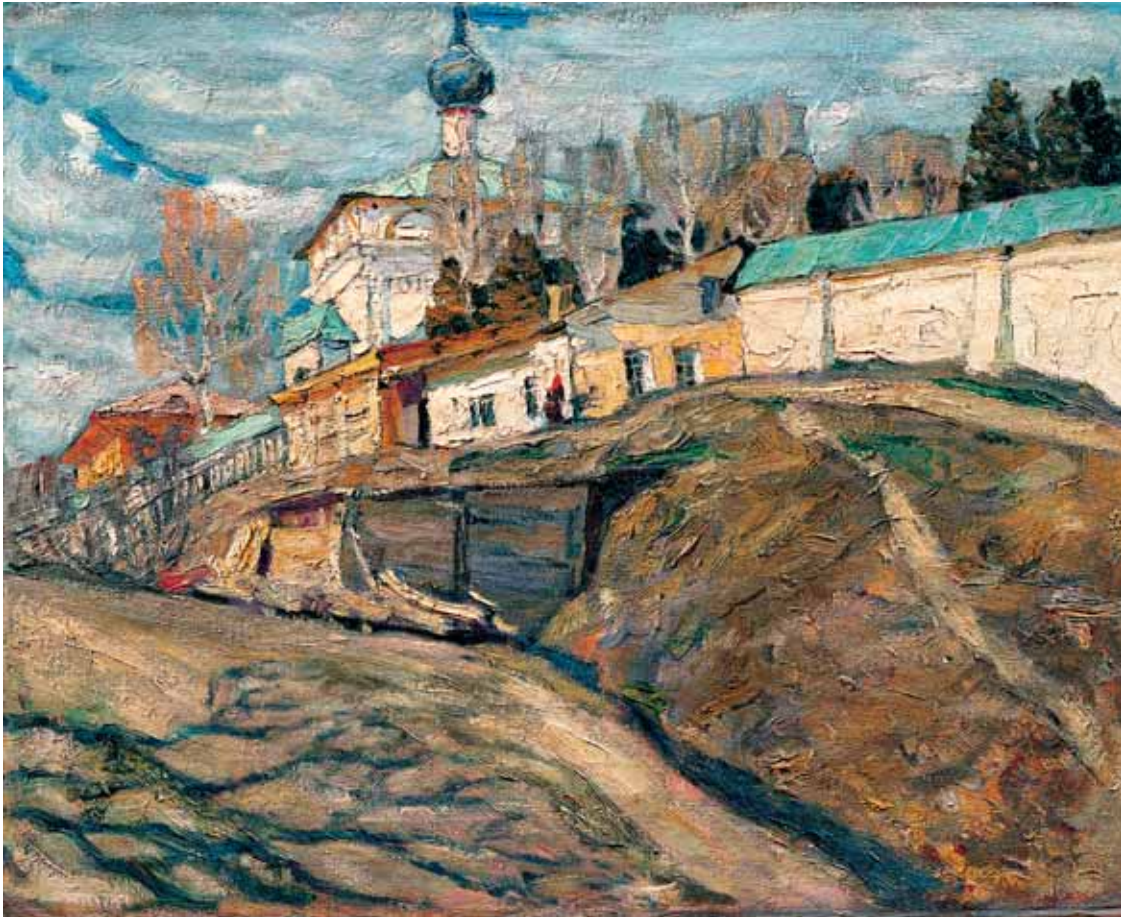
The Monastery. 1910 Oil on canvas 72.9 × 90.1 cm