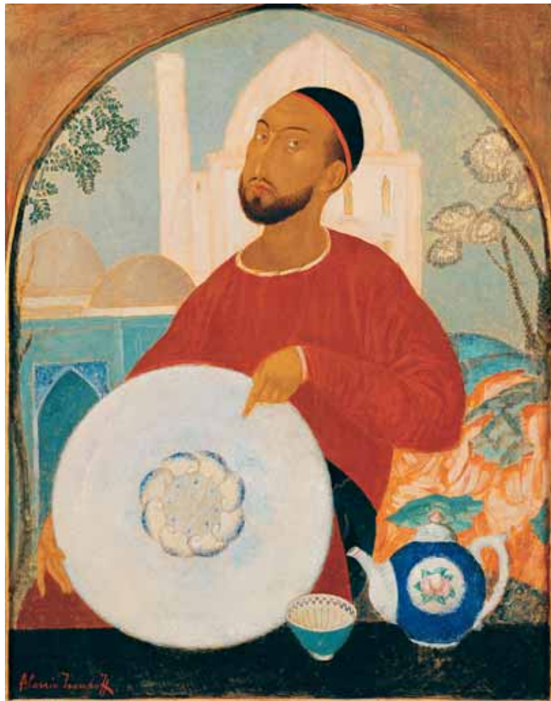
Продавец фарфора 1921 Дерево, темпера 80 × 65