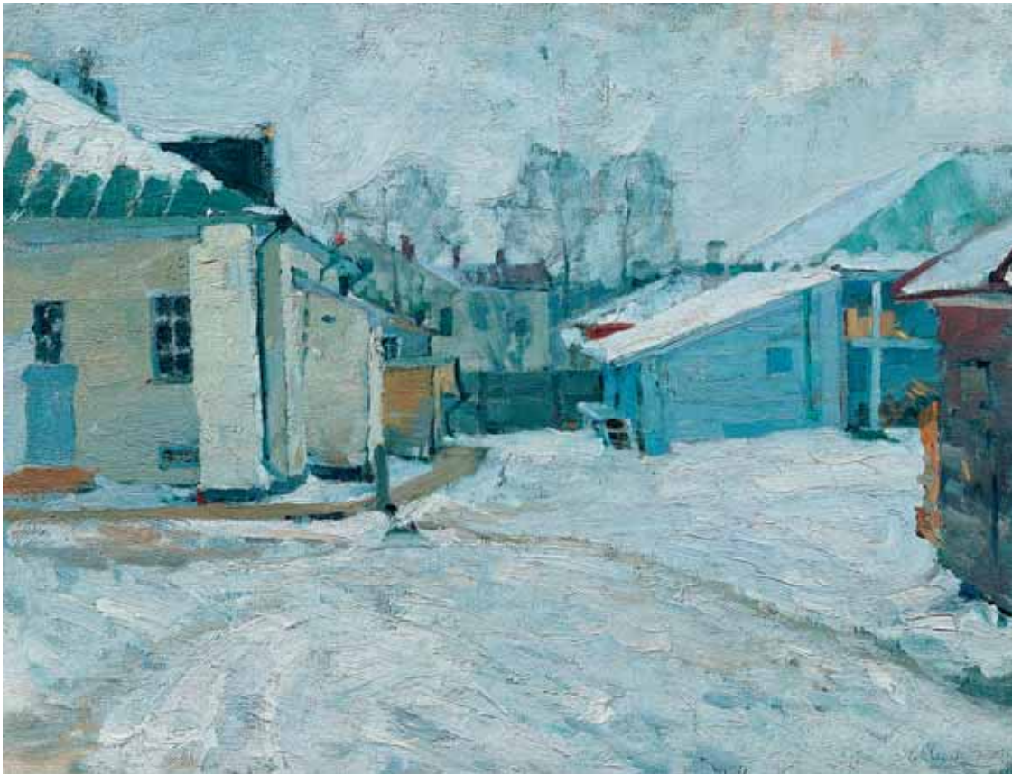
Дворик в провинции 1910 Холст, масло. 60 × 78