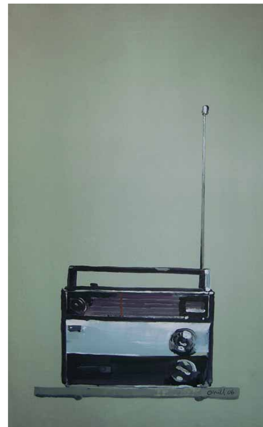
Alexander GNYLISKY Transmitter. 2006 Oil on canvas ZECH Gallery, Kiev