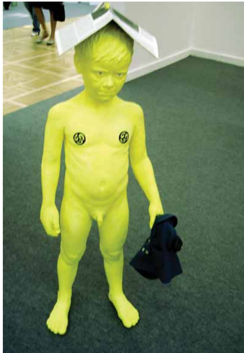
Стенд галереи "Forsblom", Хельсинки. На стене – произведения Тони Урслера и Сергея Бугаева-Африки. На переднем плане: Кит ХЕРИНГ S-man . 1987. Пластик