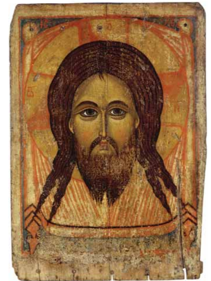
Icon: The Saviour Not-Made-by-Human-Hands, Yaroslavl, 14th century Tretyakov Gallery