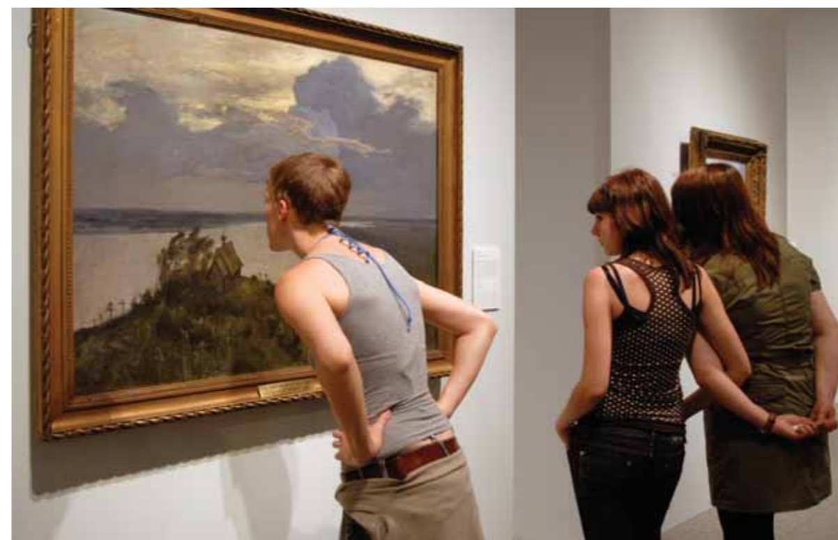
Посетители перед пейзажем И.И. Левитана «Над вечным покоем»