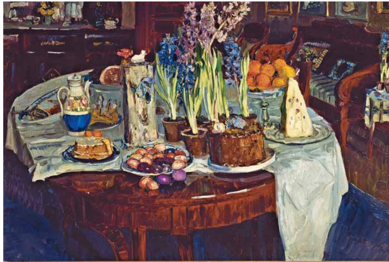
С.Ю. ЖУКОВСКИЙ Пасхальный натюрморт. 1915 Холст, масло 87,5×132,3

Stanislav ZHUKOVSKY Easter Still-life. 1915 Oil on canvas 87.5 by 132.3 cm