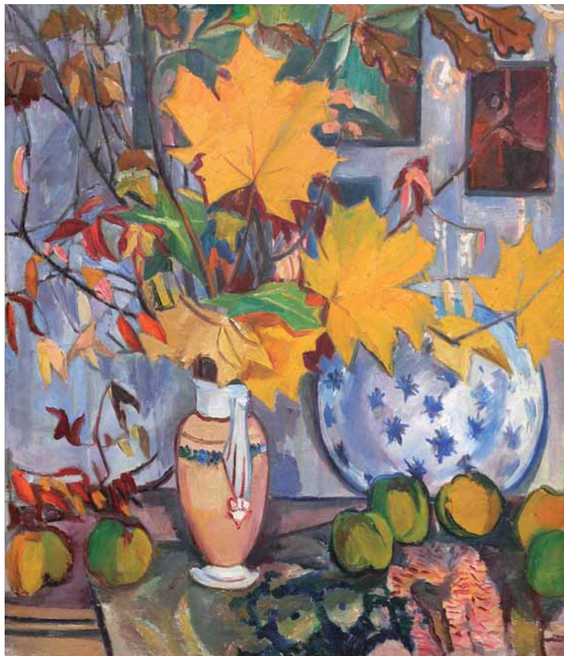
Н.С. ГОНЧАРОВА Осенний букет (Айва и листья клена). 1906 Холст, масло. 84×72

During this 150th anniversary year, the halls of the Tretyakov Gallery have presented many brilliant special exhibitions. There has also been great demand abroad for exhibitions and works on loan from the Tretyakov collection. Shows in Paris, Madrid, and New York have been tremendously successful, and Bonn and Phoenix are among the cities which will host future exhibitions.