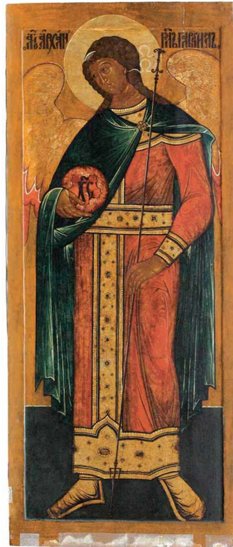
Деesis Second half of the 16th century The Novgorod School. Archangel Michael. 105 by 240 cm Archangel Gabriel. 105 by 240 cm Four-section boards, cut-back centre, three set-in counter splines. Levkas (chalk ground), tempera

The traditional culture of the North is rich and varied in its manifestations, and local museums hold numerous major works of northern art. These priceless monuments go back centuries and without them any study of the evolution of the material and spiritual culture of the Russian North would not be possible. It is no wonder that they continue to arouse interest.