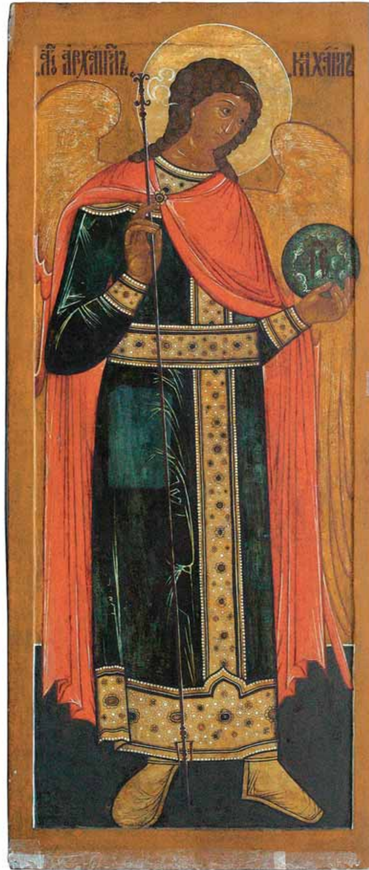
Деисусный чин. Вторая половина XVI в. Новгородская школа. Архангел Михаил. 105×240. Архангел Гавриил. 105×240 Доски из четырех частей, с ковчегом, с тремя врезными встречными шпонками. Левкас, темпера

Исследовательская работа продолжается. Еще много неизученных материалов хранится в музейных собраниях. Впереди немало интересных открытий, что позволит со временем в полной мере оценить тот большой вклад, что внесли северные мастера в отечественную культуру.