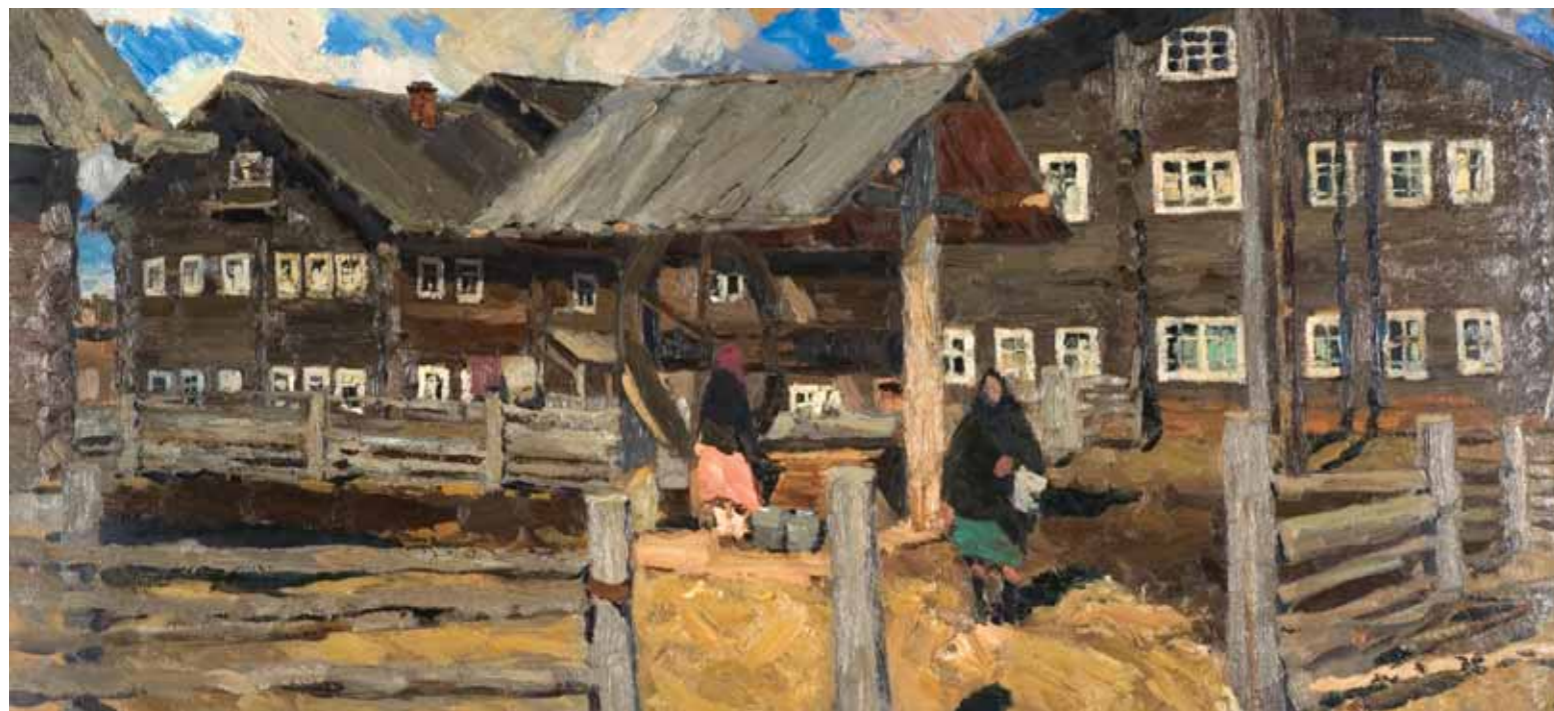
Vladimir STOZHAROV Kartpogori. The Well. 1964 Oil on cardboard 47 by 99 cm