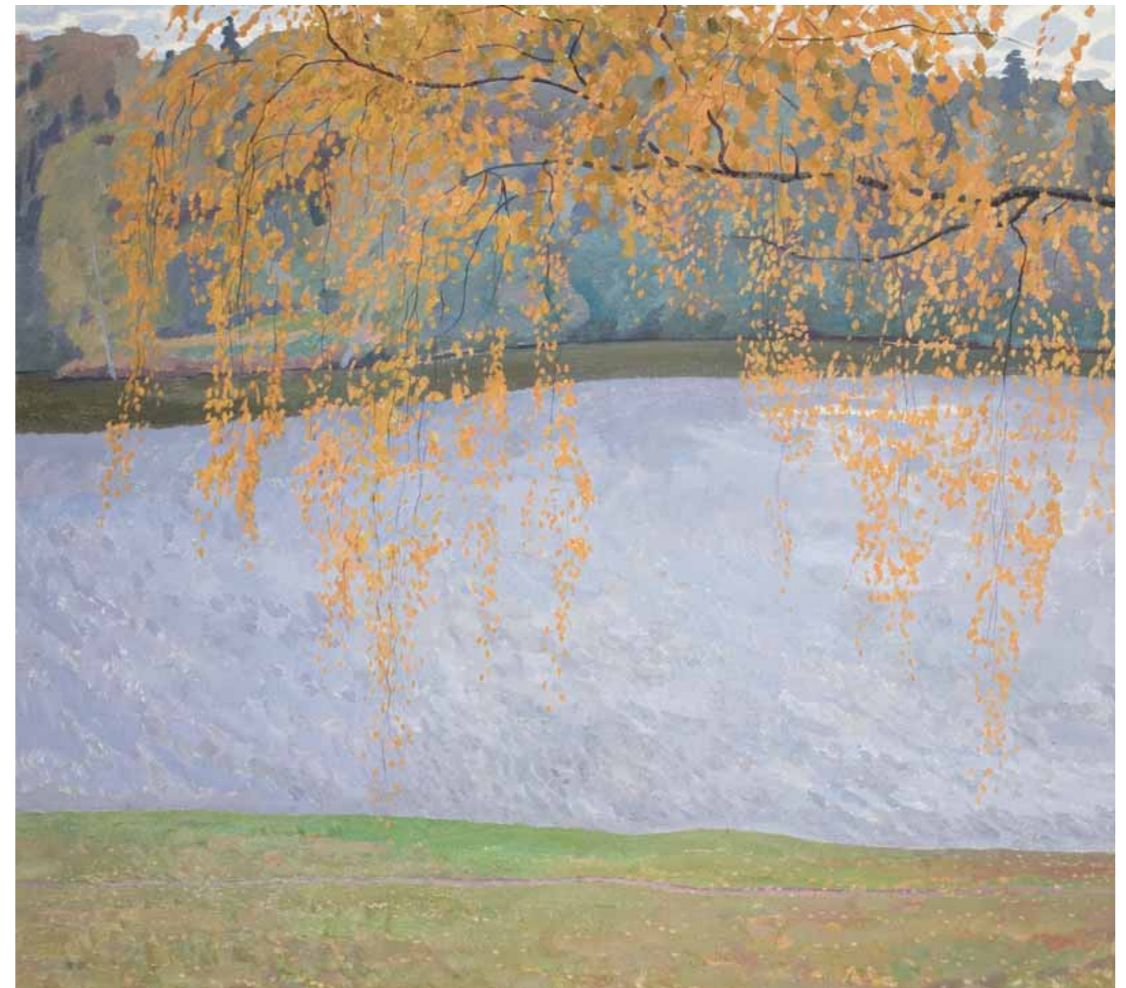
В.М. СИДОРОВ Осенние листья. 1970 Холст, масло 112×120