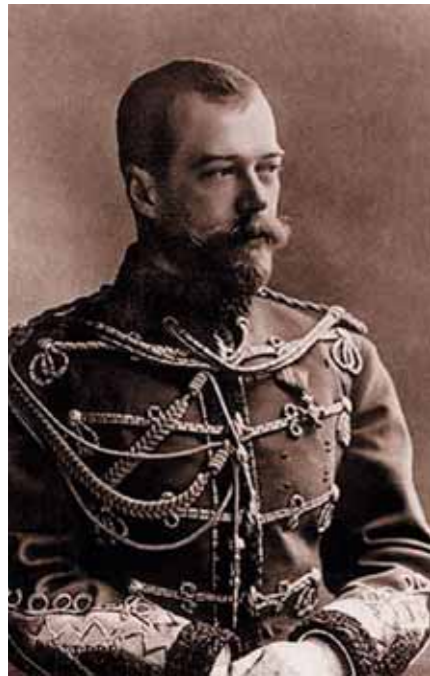
Император Николай II. 1890-е