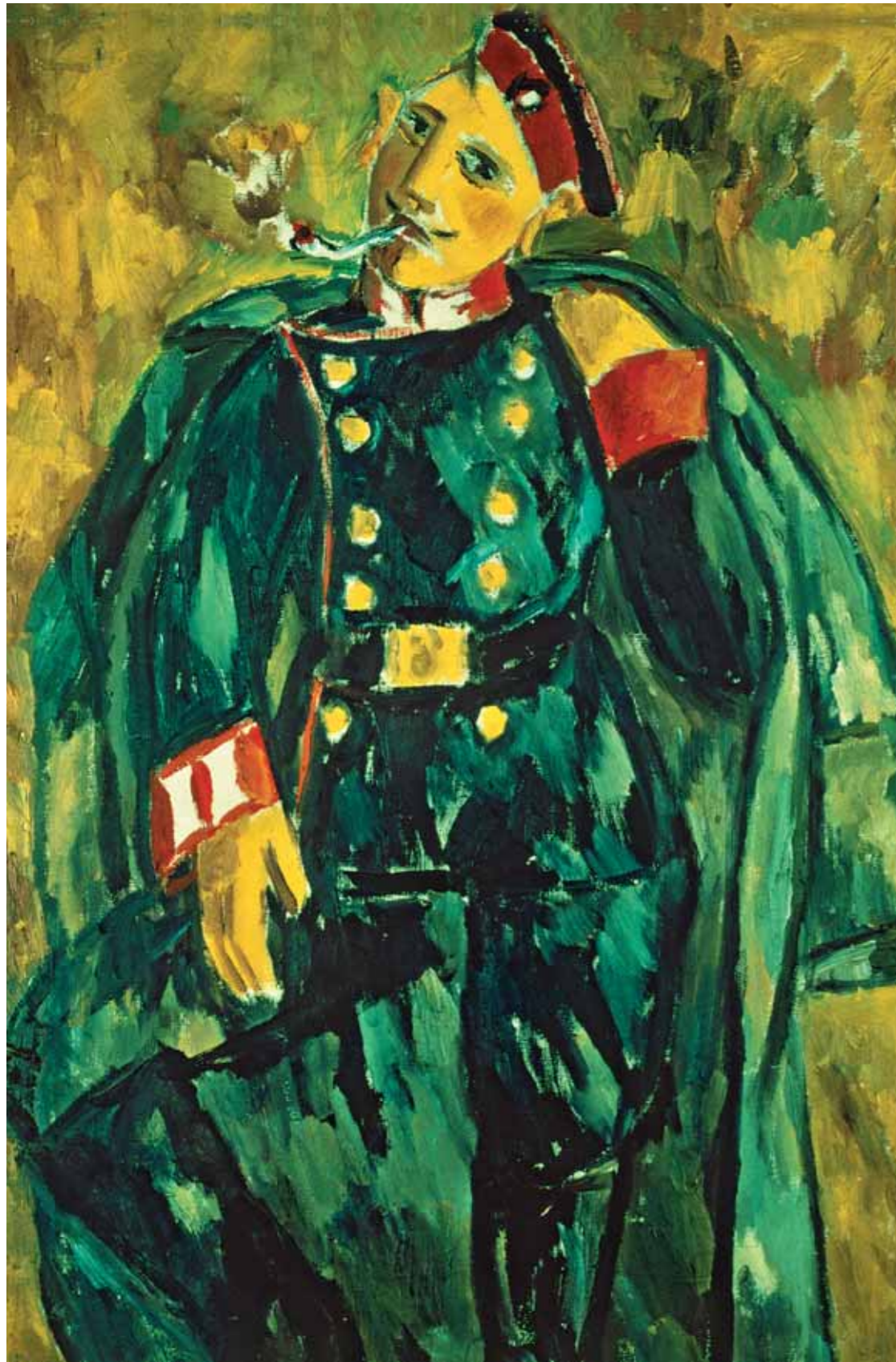
М.Ф.ЛАРИОНОВ Курящий солдат 1910-1911 Холст, масло 99x77 ГТГ

Mikhail LARIONOV Smoking Soldier 1910-1911 Oil on canvas 99 by 77 cm State Tretyakov Gallery