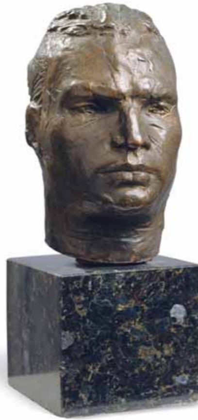
С.ДЛЕБЕДЕВА Портрет В.П.Чкалова. 1936 Бронза ГТГ

The historical value of the "RUSSIA!" exhibition is hard to overestimate, given that no other project of such a kind is comparable in the history of Russian-American cultural cooperation.