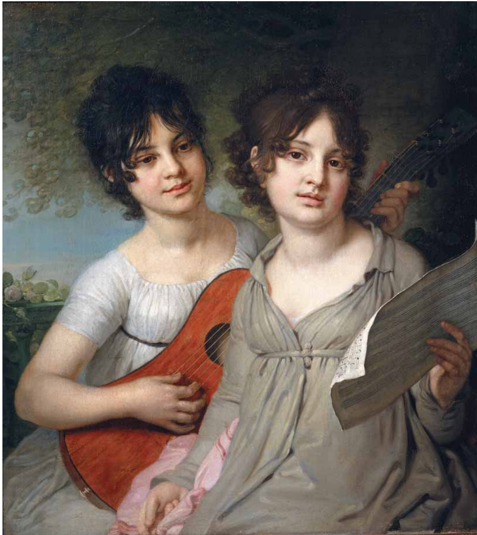
В.Л.БОРОВИКОВСКИЙ Портрет кн. А.Г.Гагариной и кн. В.Г.Гагариной. 1802 Холст, масло 75 × 69,2 ГТГ