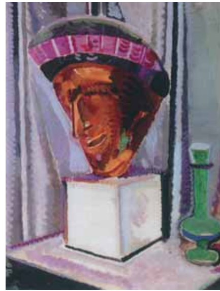
Gustaw GROZDECKI Still Life with Mask 1913 Oil on canvas 72 by 59 cm National Museum, War- saw

Художники-авангардисты, возвратившиеся из России в Польшу, вызывали настороженное отношение как адепты коммунизма. Поэтому в Польше творчество левых оказалось менее ярким и выразительным, чем в России. Однако в 1931 году возникает «Краковская группа», опиравшаяся на традиции европейского авангардизма, опыт которой будет востребован после Второй мировой войны.