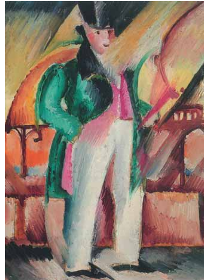
Zygmunt WALISZEWSKI Gentleman in a Green Tail-Coat . 1922 Oil on Cardboard 42 by 32 cm National Museum, Warsaw

and Tretyakov galleries. Our current exhibition includes works by a number of artists represented at that event: Boleslaw Cybis, Ludomir Slendzinski, Rafal Malczewski, Romuald Witkowski and Xawery Dunikowski. The early 1930s saw a brief resumption of cultural connections between the two countries: Sergei Prokofiev visited Warsaw on tour, whilst Karol Szymanowski came to Moscow. By 1937–38, however, virtually all links had been severed.