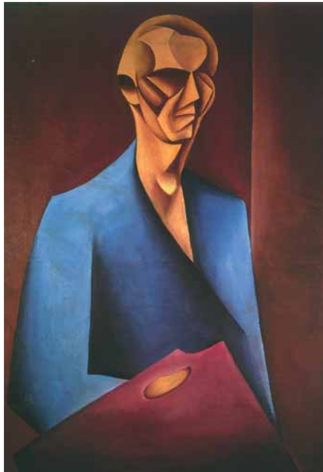
Мечислав ЩУКА Автопортрет с палитрой . 1920 Холст, масло 134,5 × 91 Национальный музей, Варшава