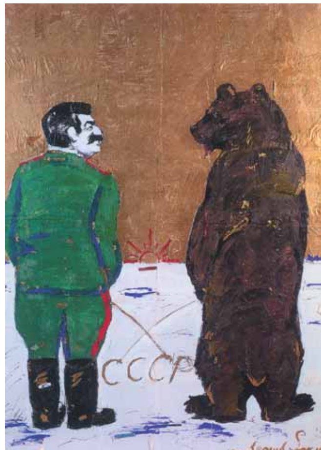
Леонид СОКОВ Сталин и медведь. 1991 Картон для мозаики Оргалит, коллаж, масло 214 x 153 ГТГ

Andrei FILIPPOV The Last Supper. 2003 Installation Collection of the artist