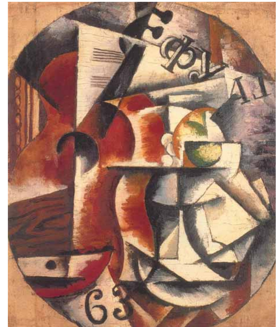
Nadezhda UDALTSOVA Guitar (Fugue) . 1914 Oil on canvas. 52.5 by 43 cm State Tretyakov Gallery