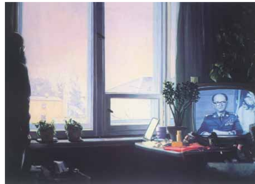
Лукаш КОРОЛЬКЕВИЧ Утро 13 декабря 1981 года. 1982 Холст, масло 136 x 190 Собственность автора

Помимо собственно художественной части проекта, еще многое было задумано организаторами с целью его расширения, превращения в фестиваль российско-польской культуры в Варшаве и в Москве. Например, интереснейшей мыслью была виртуальная реконструкция выставки произведений Казимира Малевича в гостинице «Полония» в 1927 году. Но не все оказалось возможно воплотить в жизнь в одной, даже очень крупной выставке. Остается надеяться, что она откроет дорогу новым проектам, новым идеям и формам русско-польских художественных взаимодействий.