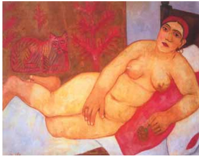
Михаил ЛАРИОНОВ Кацанская Венера . 1912 Холст, масло 99,5 × 129,5 Нижегородский государственный художественный музей