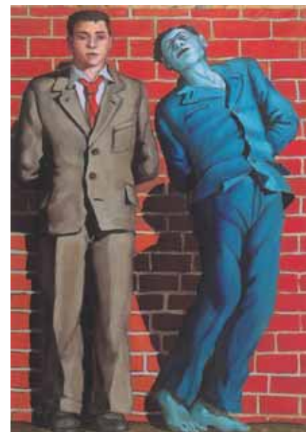
Андрей ВРУБЛЕВСКИЙ Расстрел IV . 1949 Холст, масло 120 × 90 Музей Войска Польского, Варшава

The 1962 exhibition in Moscow's Manezh was in a similar vein. Despite their lack of communication, Polish and Russian artists were clearly battling with the same issues. "Warsaw-Moscow, Moscow-Warsaw" finally brings together Russian and Polish works of the period, highlighting this virt-