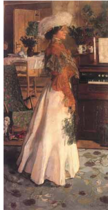
Юзеф МЕХОФФЕР Портрет жены (В загородной усадьбе). 1904 Холст, масло 191,2 × 83 Национальный музей, Краков

The deep differences which have divided Russia and Poland, in the last cent-