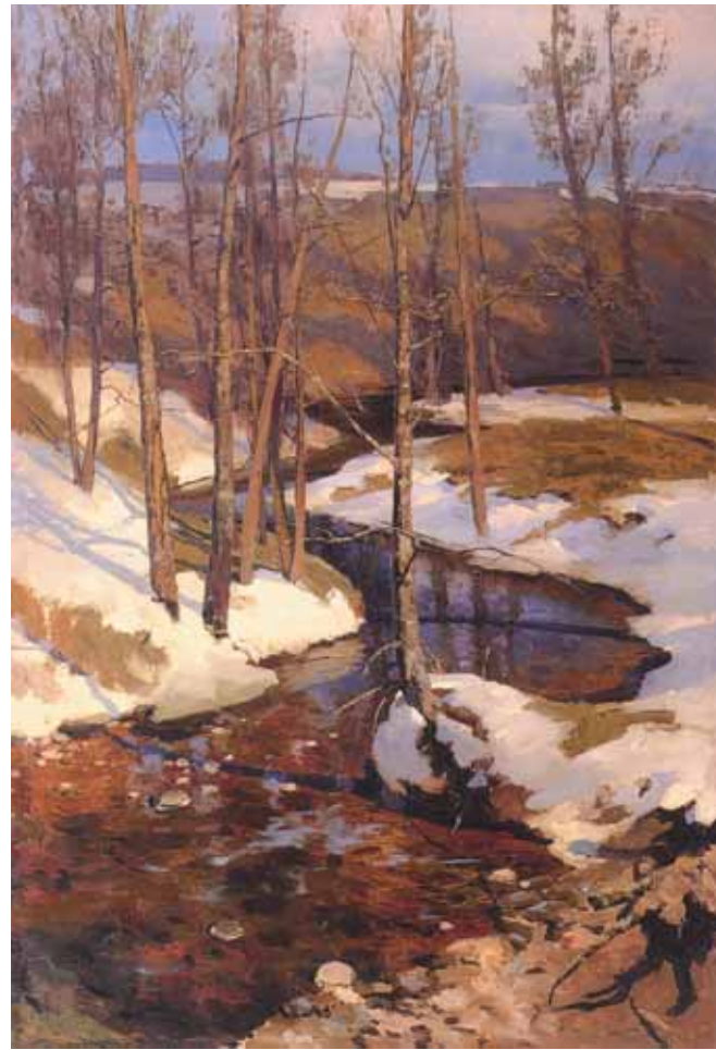
Фердинанд РУЩИЦ Весна. 1897 Холст, масло 152 x 103 ГТГ

Творчество и личность русского художника К.Малевича, поляка по происхождению, оказавшего революционное воздействие на мировую худо-