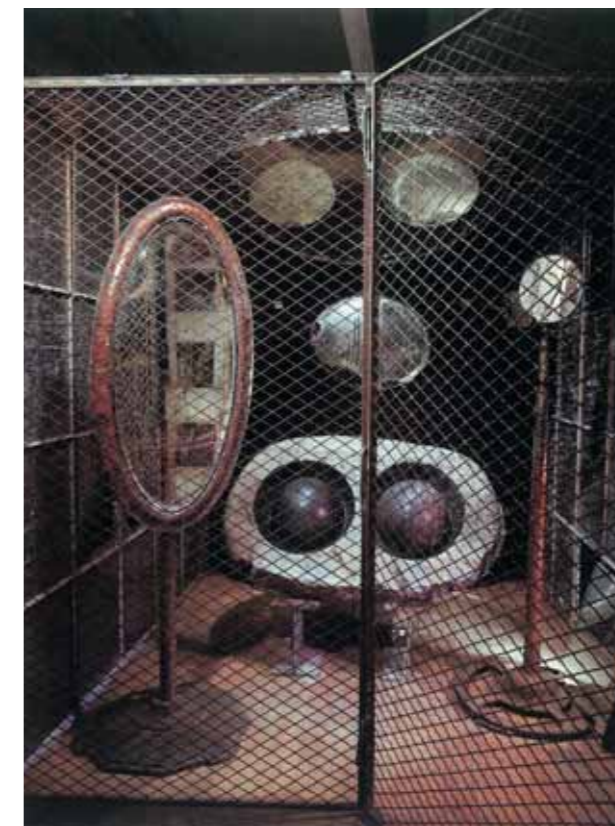
ЛУИЗА БУРЖУА Клетка (Глаза и Зеркала) 1989–1993 Сталь, стекло, мрамор, зеркала 236x210x219