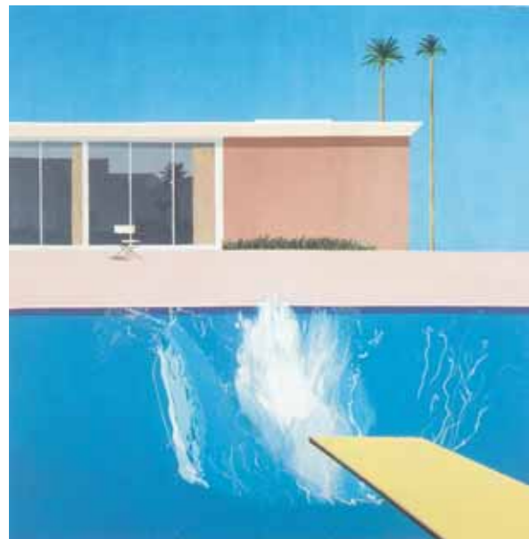
ДЭВИД ХОКНИ. Громкий выплеск. 1967 Холст, акрил. 242,5 × 243,9